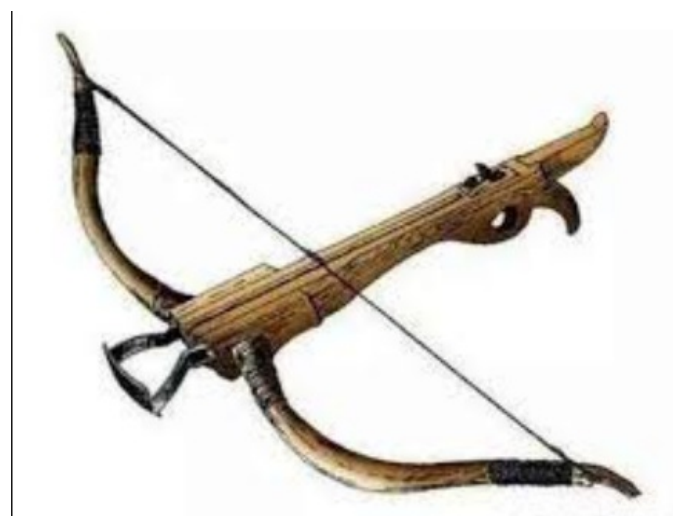
Thần tí cung