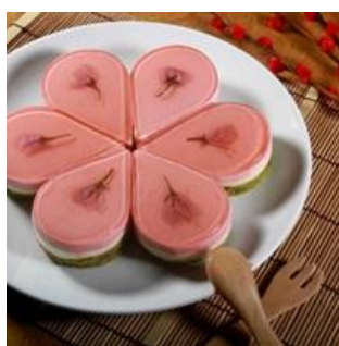
Bánh Sakura Ishoku)

Dù muốn tự làm nhưng ta vẫn không thể nghĩ ra người ta làm thế nào có thể chưng ra loại bánh gạo nếp dẻo dẻo có hương hoa ngào ngạt, êm dịu thượng đẳng này. Bánh gạo nếp chưng lên cùng cánh hoa đào, có hình tam giác nhỏ nhỏ màu hồng nhạt, năm chiếc cắt ra đến lúc ghép lại tạo thành hình một đóa hoa xinh đẹp (Đây là một loại bánh của Nhật Bản nhưng để mọi người dễ hình dung hơn nên mình vẫn bê vào cho mọi người tưởng tượng ^^