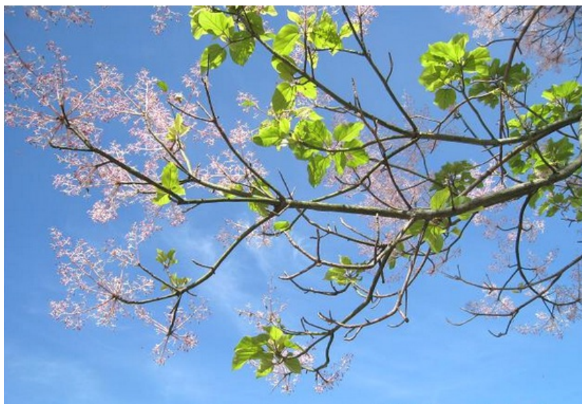
Cận cảnh một cây ngô đồng, thui thì mọi người cứ coi