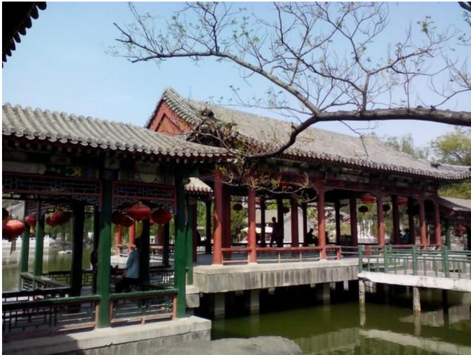
(Hình minh họa)

Ta nhẹ nhàng tiến vào chốn vinh hoa u tĩnh này, liền gặp ngay một nữ nhân mang thai đang nằm dựa vào mỹ nhân kháo trong đình cho cá ăn ( mỹ nhân kháo: bạn nào hay xem phim TQ chắc sẽ biết là ở trên lầu hay có ghế ngồi gần cạnh lan can cho nữ nhân ngồi dựa vào ngắm cảnh, mình tìm nát google cũng không tìm được định nghĩa chính xác. Các bạn cứ hình dung là trong ảnh ở cạnh lan can gỗ có mấy cái thanh để ngồi là được ^^ )