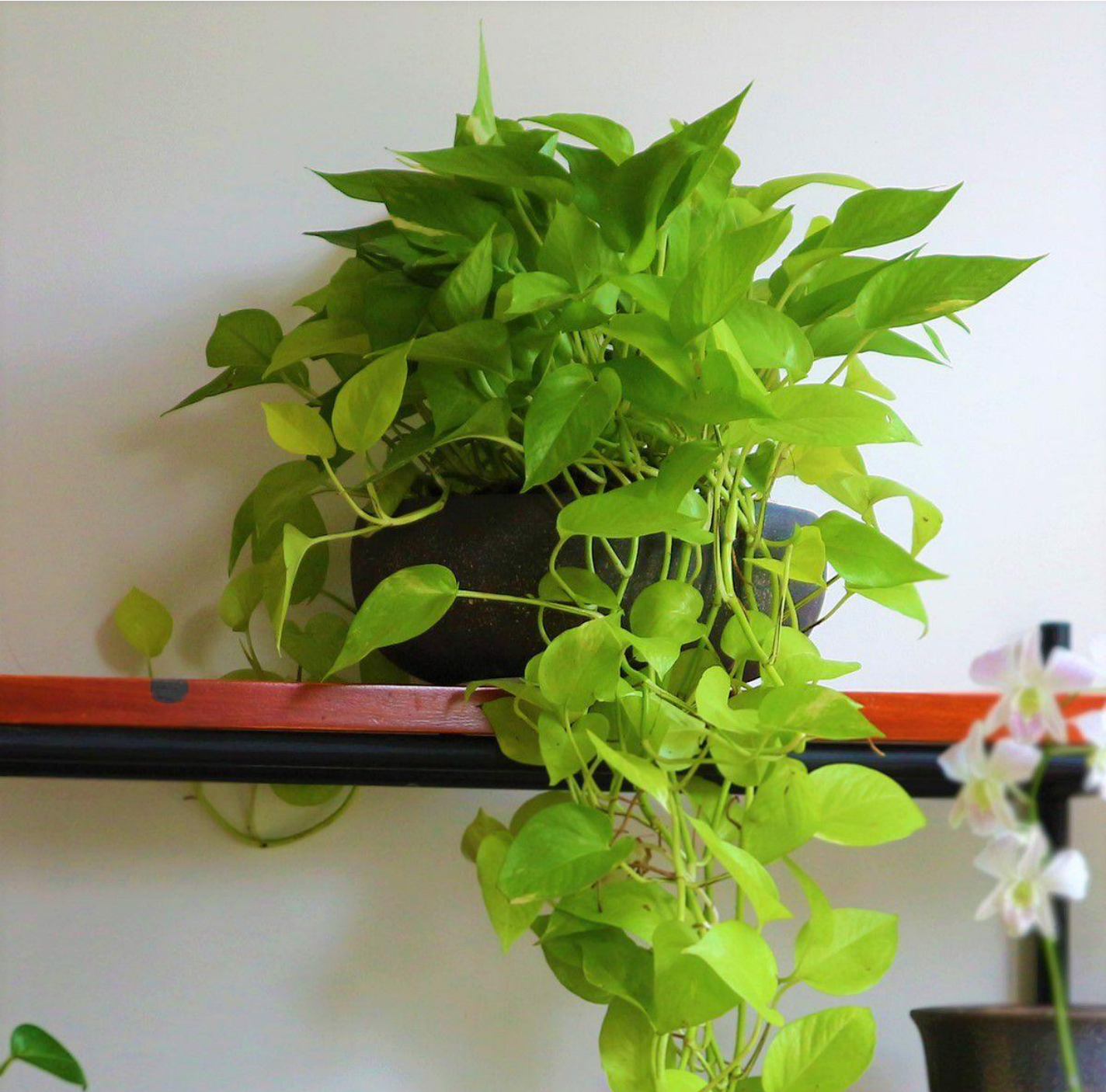
Trầu bà vàng (bên Trung gọi là Lục La)

Thẩm Kỳ không để ý tới cô, lại xoay người đi chơi đầu địa chủ. Thẩm Tụng Viện không thể làm gì, chỉ có thể uể oải xoay người trở về phòng của mình. Cả đêm cô đều nghĩ đến một vấn đề, sao cô lại nghe ra trong lời nói của anh mình đối với Chu Tư Đồng rất có ý tứ muốn bảo vệ? Thật vô lý. Nhiều năm như vậy cô chưa từng thấy anh trai bảo vệ bất kỳ người con gái nào. Bao gồm cả Trần Ánh Ánh. Tuy rằng từ nhỏ Trần Ánh Ánh luôn đi sau anh mình ôn nhu mềm mại gọi anh là Kỳ ca ca, nhưng anh ấy cũng chẳng mấy khi để ý đến cô ta. Sao đến Chu Tư Đồng này thì lại..... Anh cô hình như hôm nay mới là lần tiên nhìn thấy Chu Tư Đồng mà? Nhưng sao trong lời nói lại có phần bảo vệ cho Chu Tư Đồng như vậy? Thẩm Tụng Viện nghĩ trăm lần cũng không ra, cả đêm cũng không thể ngủ ngon. Sáng hôm sau Thẩm Tụng Viện chen chúc trên xe buýt đến trường, đến phòng học liền buồn ngủ gục xuống bàn. Bỗng nhiên thấy hàng phía trước Tề Tư Tư lúc này quay đầu nói với cô: "Ồi, mình nghe nói có học sinh bên lớp Tự nhiên muốn chuyển đến lớp chúng ta." "Bạn ta có bệnh không thế?" Thẩm Tụng Viện nâng lên mí mắt liếc tề tư tư liếc mắt một cái, "Đã đến năm cuối rồi còn muốn chuyển lớp? Còn cho mình là thiên tài à? Học lớp Tự nhiên không nổi, đến lớp Xã hội là có thể một bước lên trời chắc?" Tề Tư Tư cũng phụ họa theo. Lát sau chuông vào học vang lên. Tiết đầu tiên là môn Ngữ văn của cô chủ nhiệm - Ngô Nhã Lệ