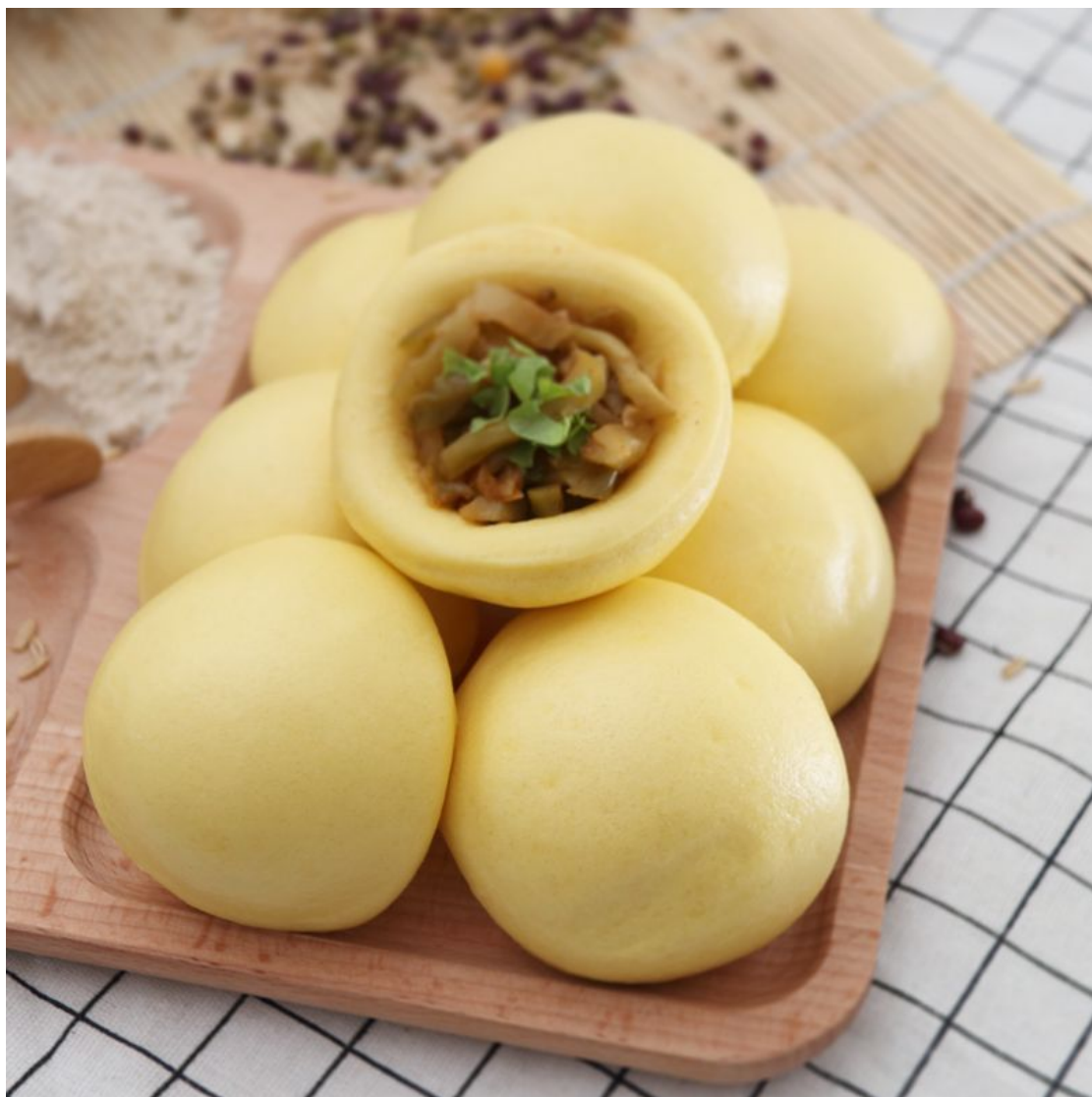
*bánh bao đen: