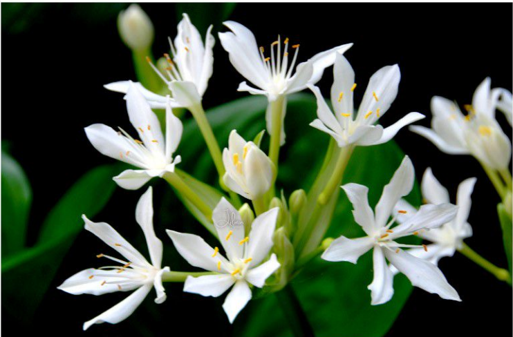
(hoa ngọc trâm)

Lục Nhiên đứng ngoài phòng nàng nóng nảy bước đi bước lại, hẳn thành thạo việc trong quan trường, thế nhưng bây giờ lại không định được chủ ý.