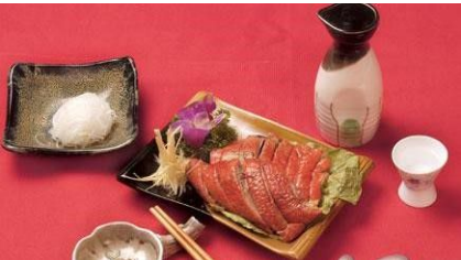
(ngỗng quay Yên Chi)

Bạn đang đọc truyện Nhân Duyên Tiên Định được tải miễn phí tại www.EbookFull.Net .