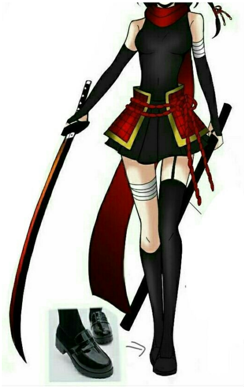
Trang phục hoạt động cùng thanh kiếm Nhật ( đều do Sarami may và rèn ở làng)