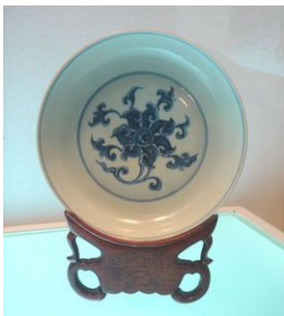
Hoa văn bảo tượng

(*) Hoa văn bảo tượng: Lần đầu tiên xuất hiện trong văn học của triều đại nhà Tống, là một trong những mẫu trang trí hoa và tranh. Một mô hình trang trí được kết hợp lại theo quy luật đối xứng vô tuyến, như hoa nở rộ, cánh hoa, nụ và lá. Lấy cảm hứng từ sự khéo léo của đồ trang sức kim loại và vẻ đẹp tự nhiên của nhiều loại hoa.