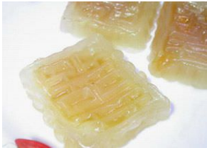
Thủy tinh tổ