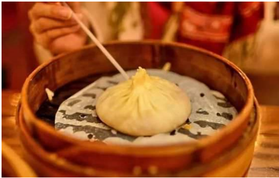
汤包 Thang bao

扬州 汤包 Thang bao (giản thể: 汤包; phồn thể: 湯包; bính âm: tāngbao): một loại bánh bao lớn, có xíu từ Dương Châu, chứa xíu trong nhân khi ăn phải uống nước nhân trước sau đó ăn vỏ.