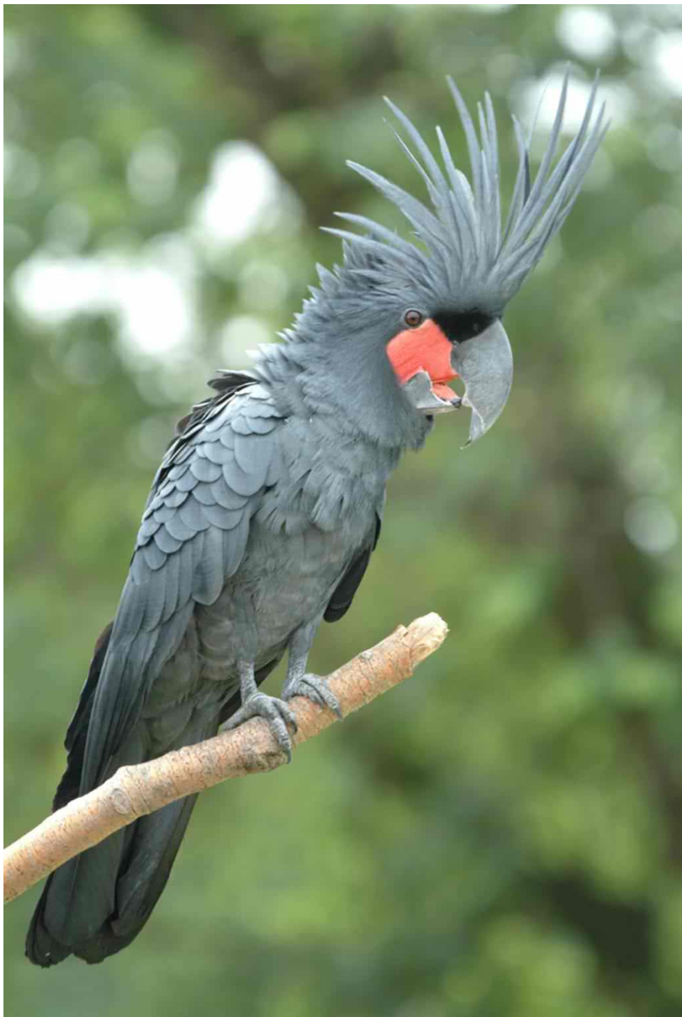
Vẹt đầu phượng màu xám

Vẹt này chỉ có Đại Chu mới có, mà số lượng cực kỳ hiếm, vì vậy cực kỳ trân quý, trong cung hàng năm cũng không được mấy con, vì vậy Lục Thanh Lam có chút hoài nghi vẹt này đến cùng có phải Tam công chúa cho hay không.