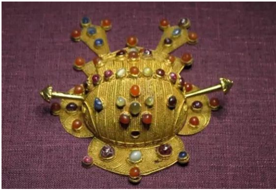
Luy ti kim quan

Hắn mỉm cười hẳn huyền cùng phụ tử Lục Thần, lại cố ý đứng ở bên cạnh Lý Ngọc áo rách lam lũ, làm cho Lục Thanh Lam nhìn thấy. Nếu bản về dung mạo, vốn Lý Ngọc cũng không kém hẳn bao nhiêu, nhưng hiện giờ được y phục này bỏ trợ, một người là vương tử, một người là tên ăn mày, hết sức rõ ràng.