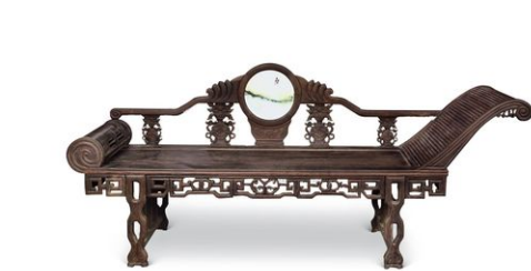
Nhuyễn tháp – 软榻

Tường Tín Hồng khách khí hai câu, Tiêu Thiệu Giác sai người tạm thời làm một cái nệm thấp*, để đại cung nữ của Tam công chúa mang đi xuống núi. Tường Tín Hồng bảo vệ ở phía sau.