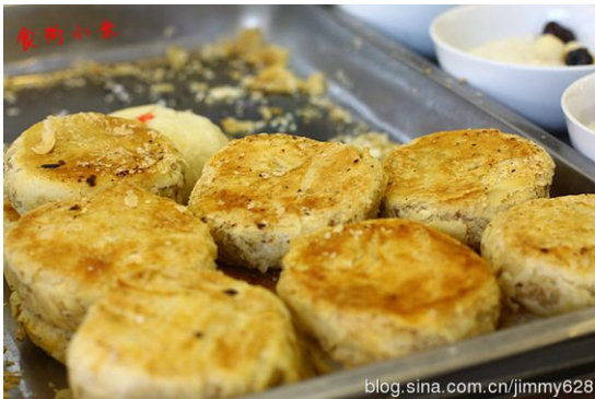
blog.sina.com.cn/jimmy628 酥火燒 [diệp tô hòa thiêu] – Bánh nướng