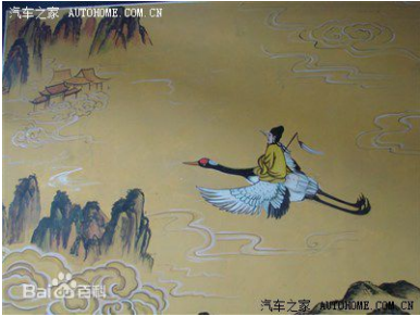
驾鹤西去 [già hạc tây khứ] “cưỡi hạc về tây”

(*) 驾鹤西去 [già hạc tây khứ] Ở Trung Quốc cổ đại, hạc thường được sử dụng như một biểu tượng của tuổi thọ, ngoài ra lia đời cũng được ví là “cưỡi hạc về tây”, hạc là một linh điều mang ý nghĩa tốt lành, thường gắn liền với thần tiên.