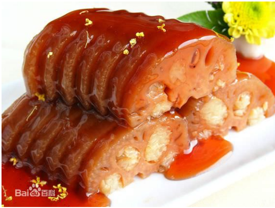
桂花米藕 – quế hoa mễ ngẫu