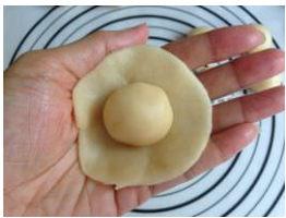
油酥面团 Du tô diện đoàn