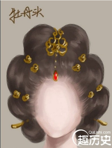
Mẫu đơn kế 牡丹髻

Mà một vị phụ nhân hai mươi ba hai mươi bốn tuổi đứng ở chính giữa, mái tóc từ dệt kim mẫu đơn đỏ thắm, rất có uy thế nữ tử, đại khái chính là Hoàng trưởng tử phi Hân Ký Nhu rồi. Chỉ thấy trên đầu nàng chài mẫu đơn kế* phức tạp, ở giữa các một cánh hoa khảm hồng bảo thạch và trân châu, hai bên lộ ra cái lược bạch ngọc khắc hoa. Nàng có một đôi lông mày dài nhập vào tóc mai, bộ dạng có chút xinh đẹp động lòng người. Lúc không cười, lại lộ ra vẻ hết sức nghiêm nghị.