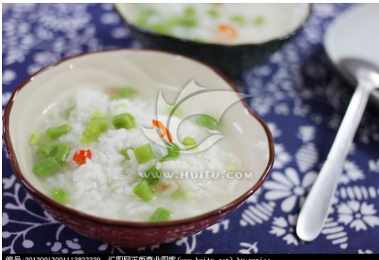
紅豆粥 [giang đậu chích] – Cháo đậu đũa

Toàn gia Lục gia đều nhìn ngáy người, Lục Thần nói: “Đây, đây là chuyện gì xảy ra?” Trên núi lớn này, ở đâu ra nấy thứ này?