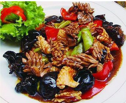
溜海参 [ lưu hải tham ] – Hải sâm xào lẫn