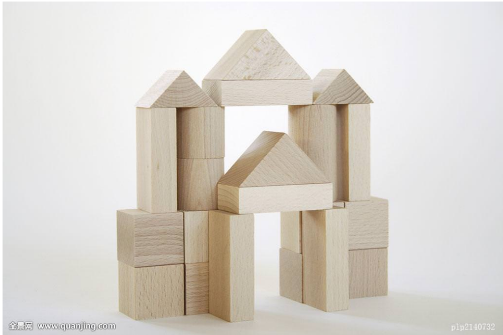
(C) 双丫髻 song nhà kế