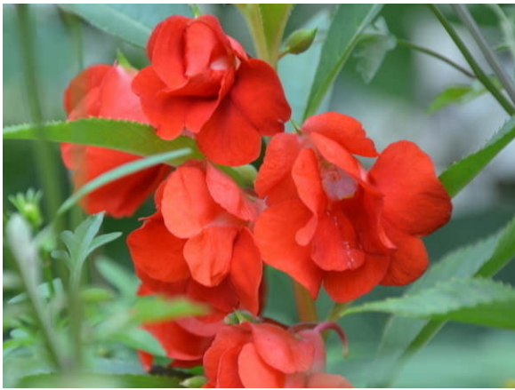
Hoa bóng nước – Phụng sơn hoa