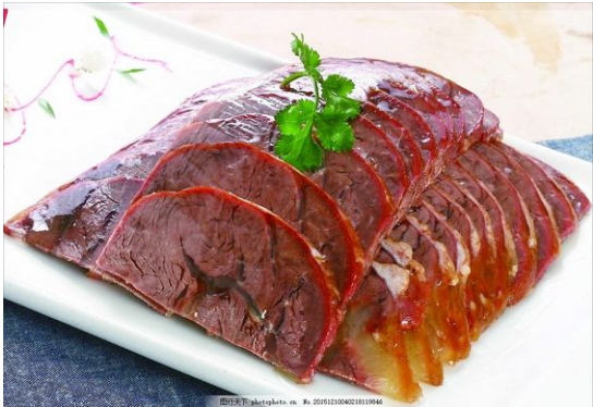
醬牛肉 [tương ngư nhục] – Thịt bò muối