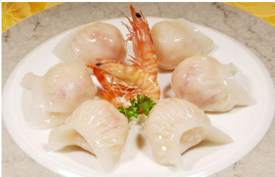
sủi cào tôm thủy tinh (水晶虾饺)