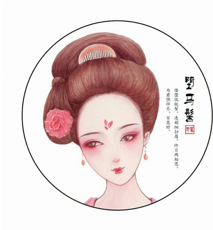
堕马髻 [đọa mã kế]