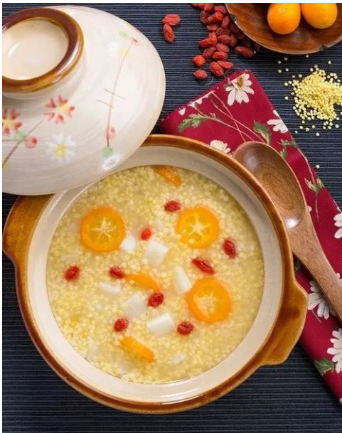
cháo kê (nhị mễ châu 二米粥)