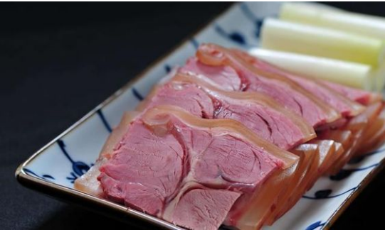
清蒸驴肉 [ thanh chưng lư nhục ] – Thịt lừa hấp cách thủy