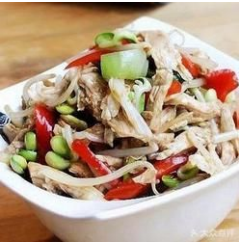
溜鸡丝 [ lưu kê tỉ ] – Gà xé xào lẫn