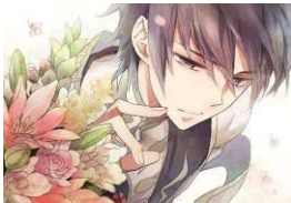
-Chào các ngài, tôi là Chu Minh Viễn, anh trai của Kiều Như.

Đi cuối cùng là Vũ Đình Thiện(nam 9 mới): tổng giám đốc của tập đoàn Vũ thị lớn mạnh nhất nhì trong nước về phương diện kinh tế. Vũ Đình Thiện là cô nhi từ khi sinh ra. Anh ta đã một mình gây dựng được tập đoàn hùng mạnh như bây giờ lại còn đẹp trai nên cũng là mục tiêu của các cô gái. Anh có đôi mắt màu tím cùng màu với mái tóc. Bộ lễ phục anh mặc có màu đen rất chín chu.