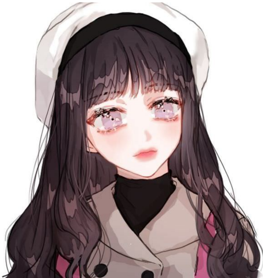
Khi học trung học (lần hai gặp Minh ca)