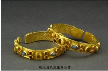
湖北随州曾侯乙墓出土