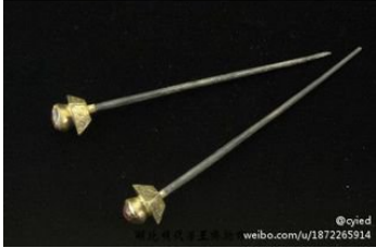
湖北随州曾侯乙墓出土