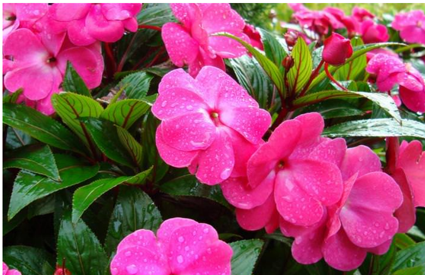
Hoa bóng nước – Phụng sơn hoa

Bạn đang đọc truyện Hoàng Gia Sùng Túc được tài miễn phí tại www.EbookFull.Net .