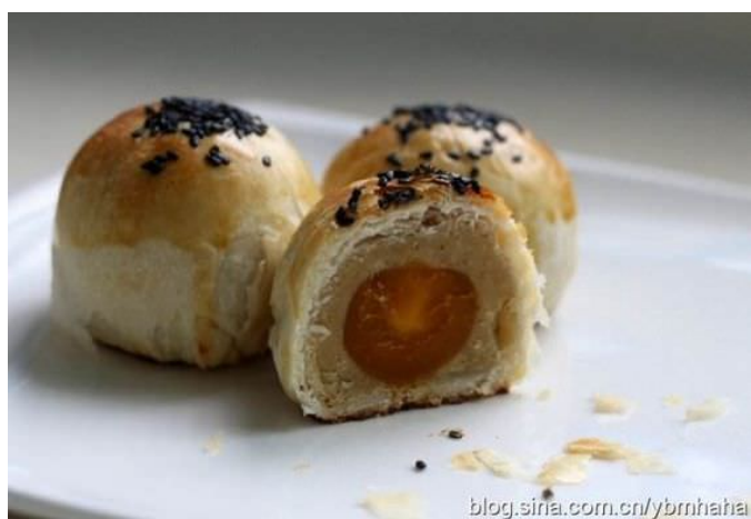
油酥面团 Du tô diện đoàn