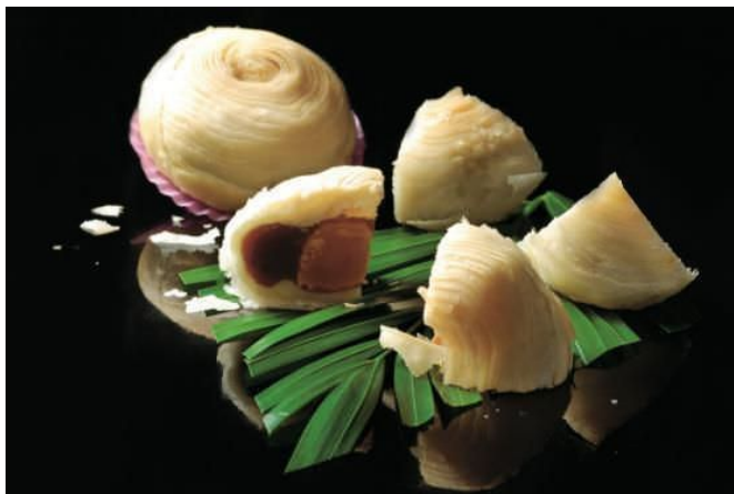
Long Nhân tở