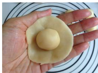
油酥面团 Du tô diện đoàn