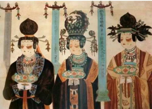
Hồi cốt kễ

Trong mắt người tình hóa tây thi, Kỷ Hải nhất thời cảm thấy thiếu nữ này quả thực giống như là tiên nữ trong Thiên cung hạ phàm, nhìn nàng si ngốc không nói nên lời.