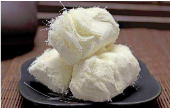
(*) 银丝糖[Ngân ti đường]

Vinh ca nhi tuổi còn nhỏ, được cả nhà cưng á, vẫn hi vọng có một đệ đệ nhỏ hơn hẳn để có thể chơi đùa cùng hẳn. Biết tam phòng có thêm tiểu đệ đệ, nhưng phụ thân mẫu thân lại không chịu để hẳn và tiểu đệ đệ chơi đùa, trong lòng hẳn hết sức buồn rầu, lần này rốt cục có cơ hội, liền mang ngân ti đường mình thích nhất ra.