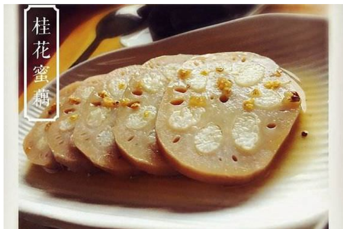
桂花米藕 – quế hoa mễ ngấu