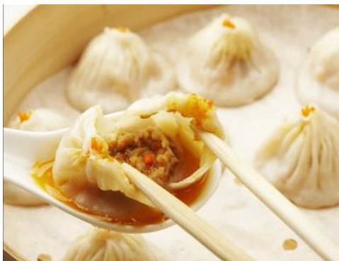
thang bao gạch cua (蟹黄汤包)

Trình Phi cười gọi hân ngồi xuống. Tiêu Thiệu Giác nói: “Mẫu phi, nhi tử nói đã mấy lần, nhi tử thức dậy sớm là vạn bất đắc dĩ, người cũng đừng có chịu tội cùng nhi tử, nếu Hoàng hậu nương nương cũng nói giờ Thìn lại đi thỉnh an, sao người không ngủ thêm chút nữa?”