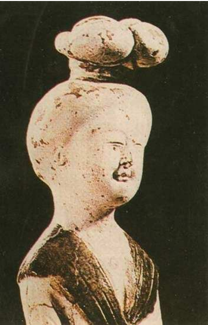
Hồi cốt kễ

Kỷ Hải ở chỗ này lo lắng chờ đợi, qua gần nửa canh giờ, đã nhìn thấy xa xa đi tới vài người, cầm đầu một cái thiếu nữ mặc một bộ búi tử hải đường màu hồng thêu hoa ngư mỹ nhân, thoát nhìn hết sức tươi sáng, đầu búi hời cốt kễ*, trong tóc mây cắm một cây trâm như ý ngà voi, da trắng như tuyết, đôi mắt sáng ngời.