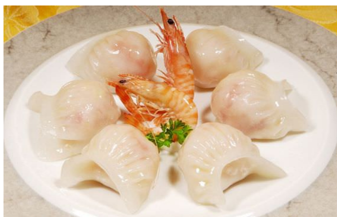
sủi cào tôm thủy tinh (水晶虾饺)