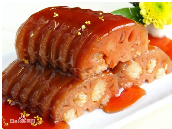
桂花米藕 – quế hoa mễ ngấu