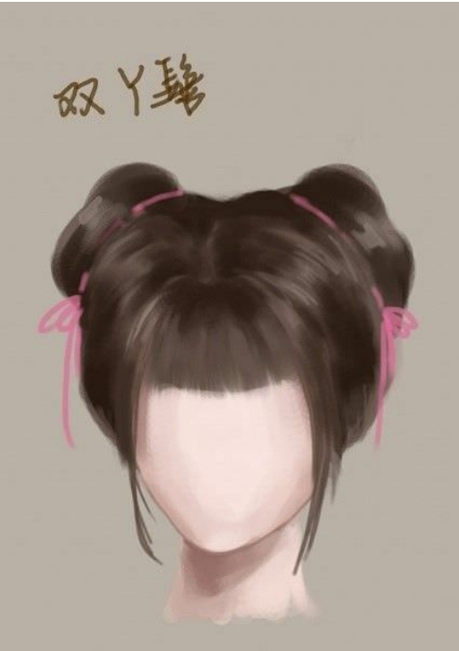
Song nha kế

Lục Thanh Nhân nhìn nàng một cái, thấy tiểu cô nương mặc quần áo màu xanh biếc lục bích, chài song nha kế*, mặc dù mập hơn so với mình một chút, nhưng mặt mày tròn trịa, ngũ quan tinh xảo, nói không hết ngây thơ khá ái. Nhớ tới bọn hạ nhân cũng lên lên nghị luận, nói Tiểu bản tử này bộ dạng đẹp mắt hơn nàng, tính tình cũng tốt hơn nhiều so với nàng, Lục Thanh Nhân càng tức giận.