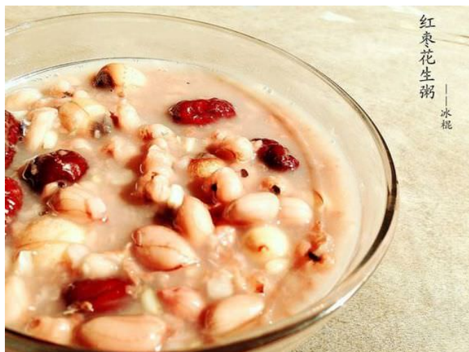
cháo táo tàu (kim tì táo chúc 金丝枣粥)