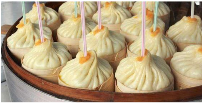
汤包 Tang bao