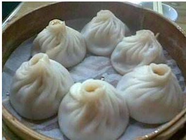
汤包 Tang bao

Tiêu Kỳ nói: “Kính mời Trình nương nương nếm thử tay nghề đầu bếp này xem sao.”