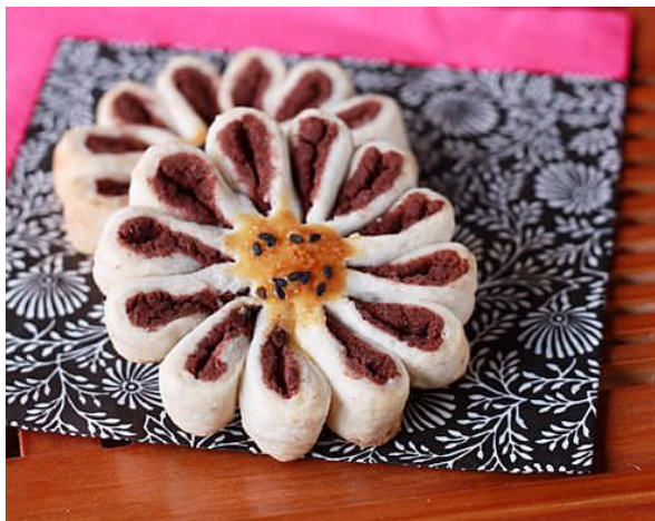
Hoa cúc tở