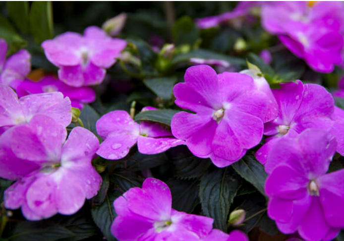
Hoa bóng nước – Phụng sơn hoa