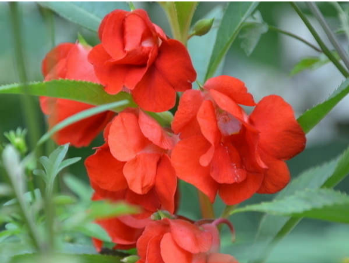
Hoa bóng nước – Phụng sơn hoa

Đúng vào lúc này, Lục Ngạc nâng một cái khay chạm khắc sơn đỏ đi đến, bên trên để một chén thuốc giữ thai. Trong mắt Triệu Huệ Lan hiện lên vẻ mặt âm tàn, đứng dậy đi tiến lên, “Lục Ngạc tỷ tỷ, để cho tỷ thiếp hầu hạ tỷ tỷ uống thuốc đi.”