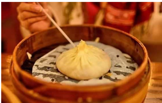
汤包 Thang bao

扬州汤包Thang bao (giản thể: 汤包; phồn thể: 湯包; bính âm: tāngbao): một loại bánh bao lớn, có xíu từ Dương Châu, chứa xíu trong nhân khi ăn phải uống nước nhân trước sau đó ăn vỏ.