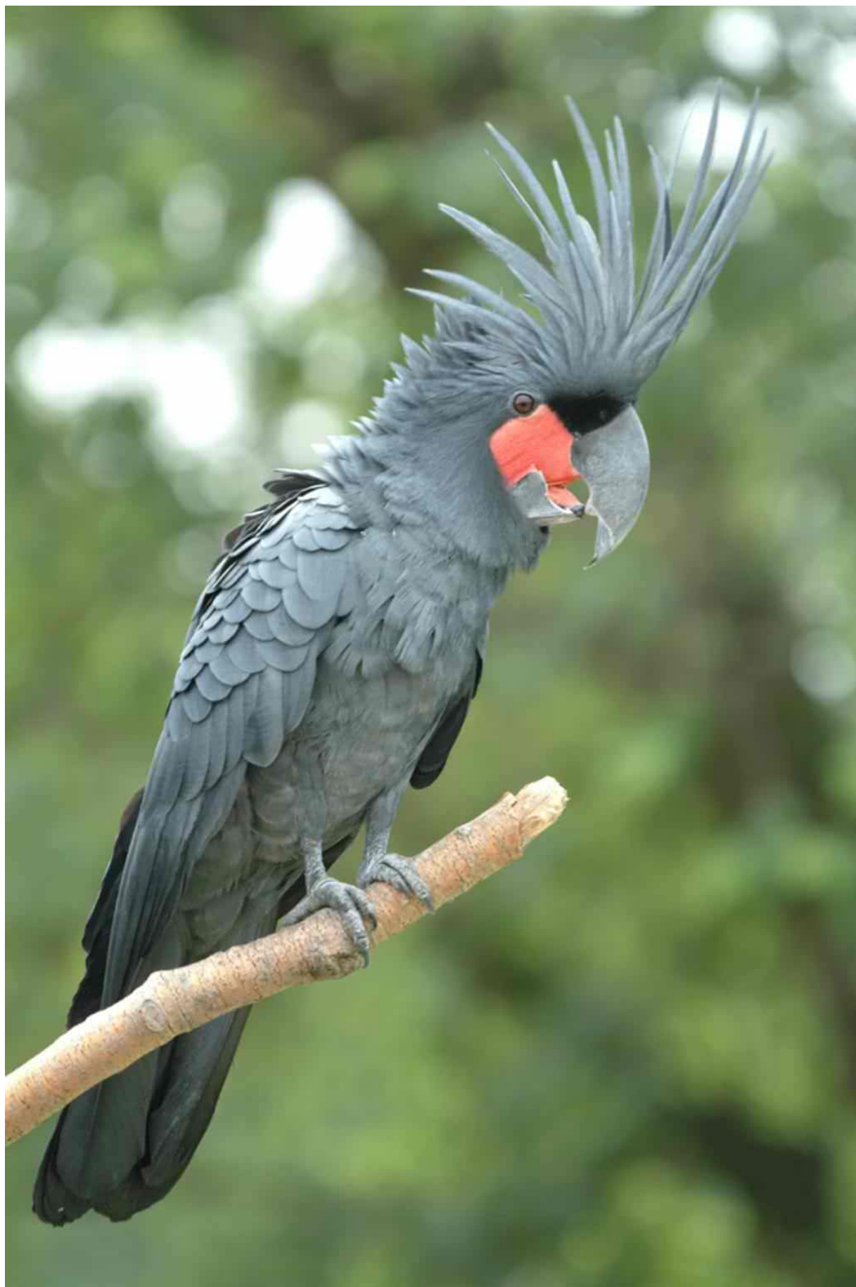
Vẹt đầu phượng màu xám

Vẹt này chỉ có Đại Chu mới có, mà số lượng cực kỳ hiếm, vì vậy cực kỳ trân quý, trong cung hàng năm cũng không được mấy con, vì vậy Lục Thanh Lam có chút hoài nghi vẹt này đến cùng có phải Tam công chúa cho hay không.