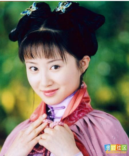
Song nha kế

“Không tới phiên ngươi ra lệnh ở đây, ta đã kêu người đem thang tới rồi, ngươi cút ngay cho ta!” Nàng cũng không ngu, nếu Lục Thanh Lam trở lại rồi, Kỳ thị đại khái cũng không ở xa. Vừa nói liền đẩy Lục Thanh Lam một cái, vốn cũng không có gì, nhưng Lục Thanh Lam không đề phòng, bị nàng đẩy ngã trên mặt đất.