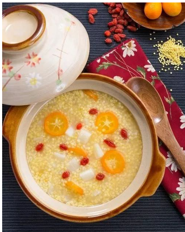
cháo kê (nhị mễ chúc 二米粥)