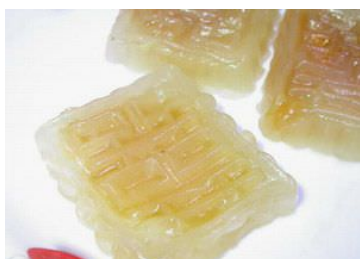
Thùy tinh tở