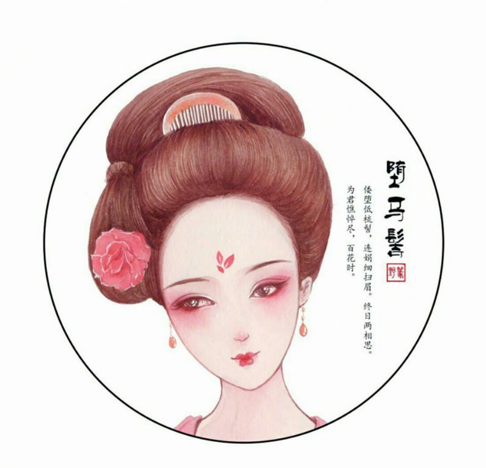
堕马髻 [đọa mã kê]

Tiền Song tới trễ, có người lại tới trễ hơn cả nàng ta. Chỉ thấy một nữ hài mặc tiểu áo thạch lựu đỏ thêu hoa thạch lựu, váy trắng ngà voi bạch mấn thêu hồ điệp kim tuyến hai màu đỏ tay cung nữ đi đến. Nữ hài kia trên đầu vấn đóa mã kê* tinh xảo, ở giữa gần trăm cái trăn châu vàng ròng, đi đường trăm cái chạm nhẹ vào trán nàng, dung mạo không thể coi là khuynh quốc khuynh thành, lại có cảm giác ung dung hoa quý trang trọng khác. (*) 堕马髻 [đọa mã kê] kiểu dáng búi tóc của phụ nữ cổ đại. Bởi vì đem búi tóc đặt lệch xuống sang một bên, hình dạng như rơi xuống như không. Là kiểu tóc của phụ nữ thời Ngụy Tấn. Đọa mã kê được tương truyền là phát minh của thế tử Tôn Thọ của Lương Kỷ quyền thần thời Đông Hán.