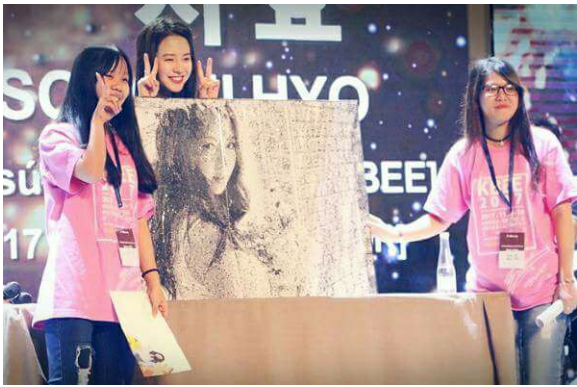
Và đây món quà lớn nhất của SA chúng ta tặng Ji: Tấm ảnh ghép từ 7012 tấm nhỏ. Bên trong rất nhiều cut sence của SA.