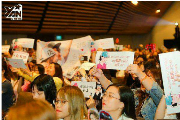
Có thấy tấm banner phía xa không? Nó đó ^^