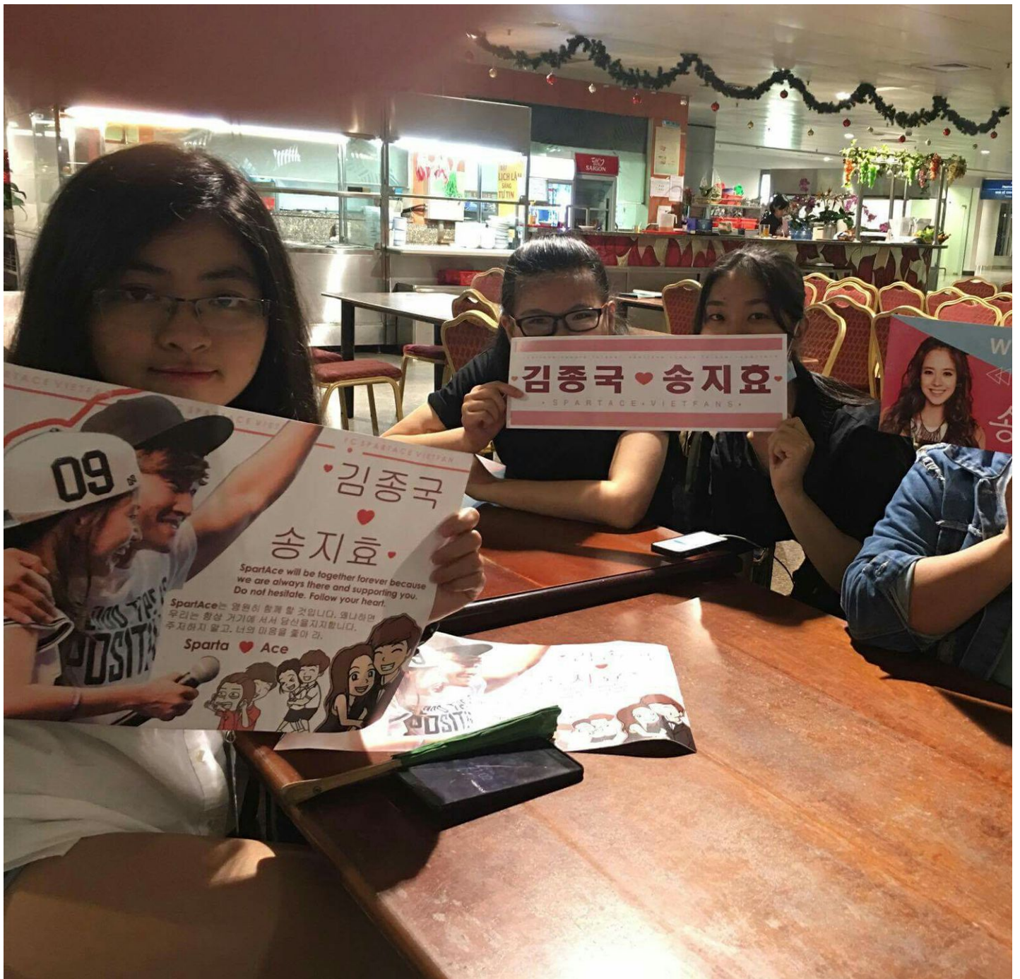
Banner nhỏ. Lúc ngồi chờ ở sân bay đón Ji. Tiếc là chỉ dùng nhân thuật Ninja đi cửa Nội Bộ nên không gấp được.