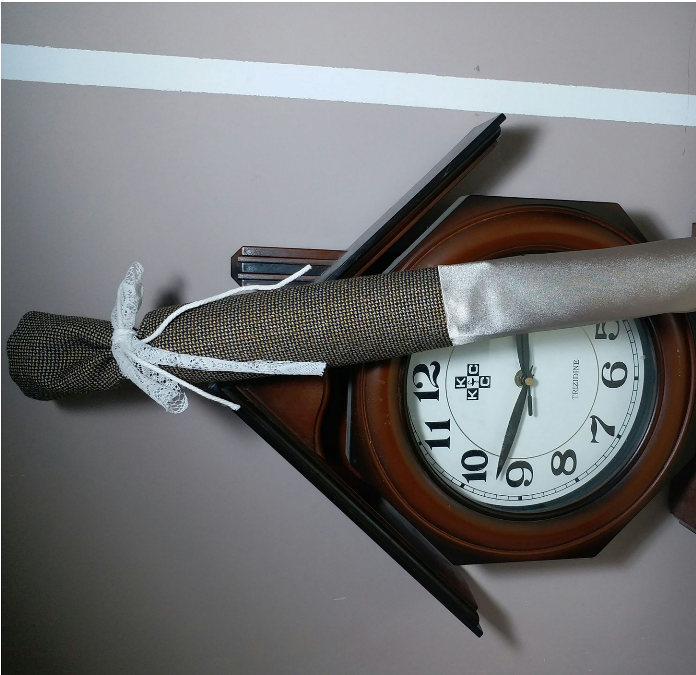
Au may cái túi bỏ tấm banner vào nè.