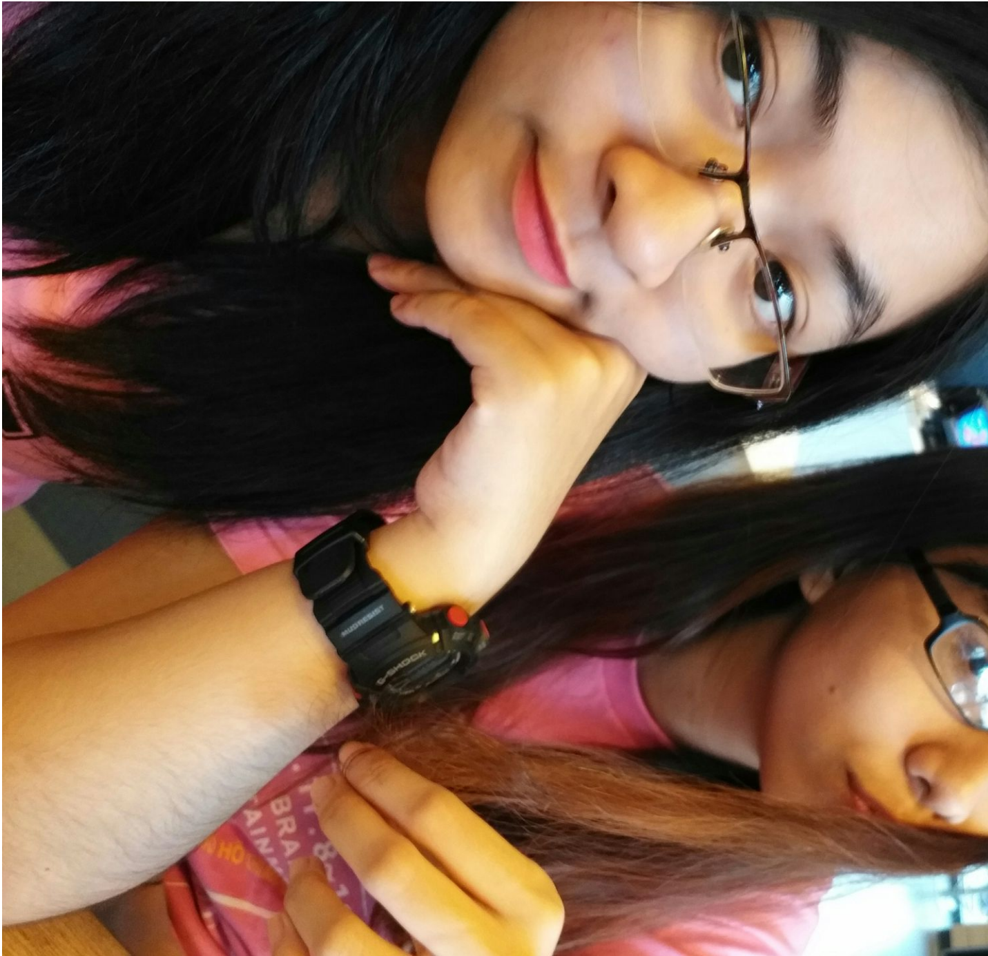
Au cùng Admin page SA.