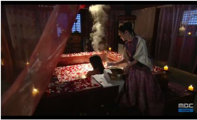
Mái tóc đen nhỉnh được chải mượt mà, buồng xoà trông càng trở nên xinh đẹp.