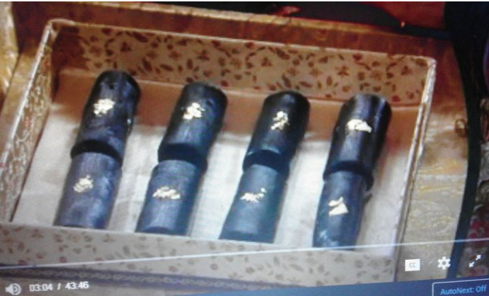
(Hình ảnh bánh mè đen hoàng kim- Trích từ phim Cung Tâm kế)

- Hôm nay nô tỳ đặc biệt mang đến món bánh mè đen hoàng kim đến cho nương nương thưởng thức.