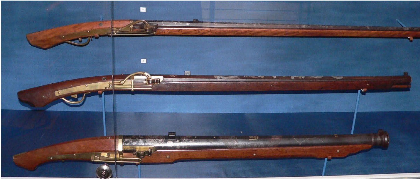
Khoá kẹp tay