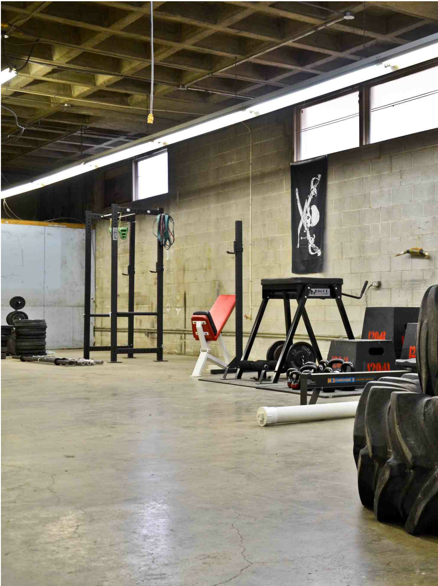
súng etpigon còn gọi là súng hoá mại