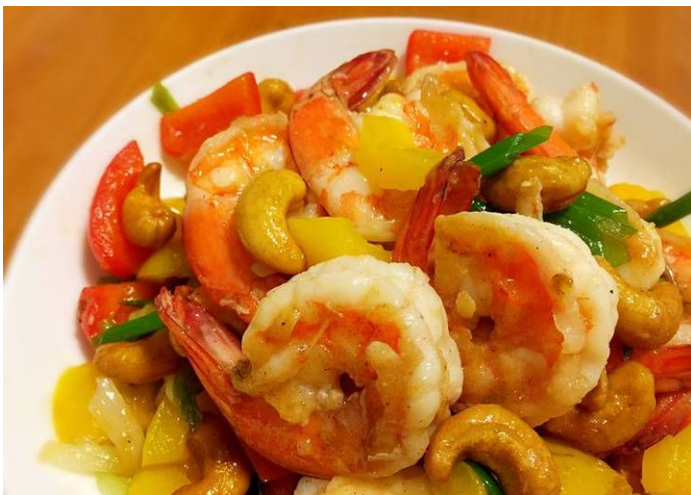
(nồi canh thập cẩm)