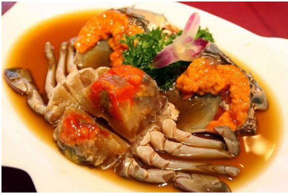
(gà lá sen)

(*tủy gà = cua say = món cua được chế biến cùng với rượu)