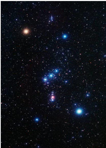
(**chòm sao kỳ lân.)