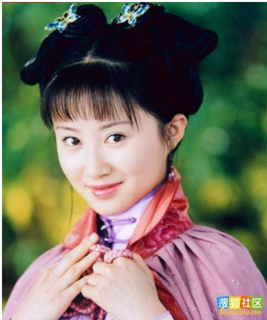
Song nha kế

“Không tới phiên ngươi ra lệnh ở đây, ta đã kêu người đem thang tới rồi, ngươi cút ngay cho ta!” Nàng cũng không ngu, nếu Lục Thanh Lam trở lại rồi, Kỳ thị đại khái cũng không ở xa. Vừa nói liền đẩy Lục Thanh Lam một cái, vốn cũng không có gì, nhưng Lục Thanh Lam không đề phòng, bị nàng đẩy ngã trên mặt đất.