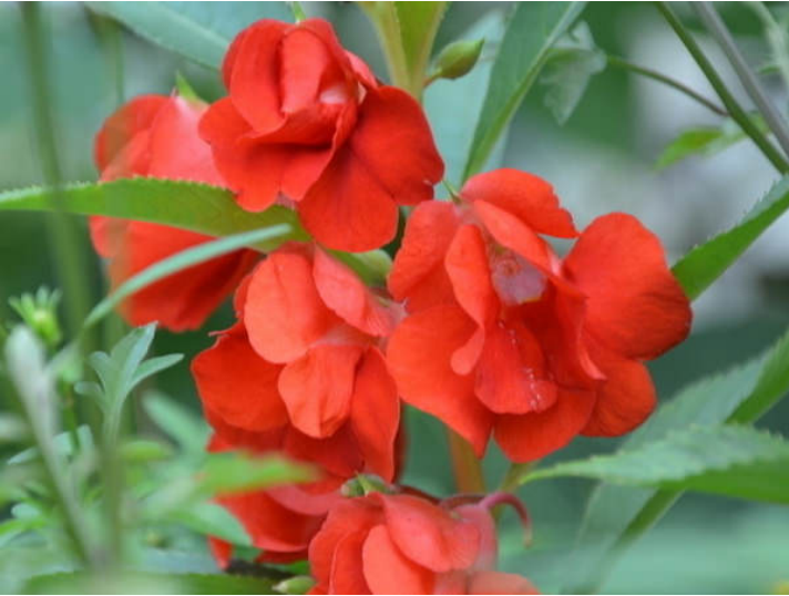
Hoa bóng nước – Phụng sơn hoa

Đúng vào lúc này, Lục Ngạc nâng một cái khay chạm khắc sơn đỏ đi đến, bên trên để một chén thuốc giữ thai. Trong mắt Triệu Huệ Lan hiện lên vẻ mặt âm tàn, đứng dậy đi tiến lên, “Lục Ngạc tỷ tỷ, để cho tỷ thiếp hầu hạ tỷ tỷ uống thuốc đi.”