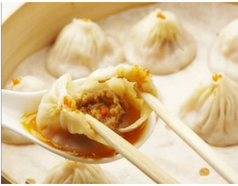
thang bao gạch cua (蟹黄汤包)

Trình Phi cười gọi hân ngồi xuống. Tiêu Thiệu Giác nói: “Mẫu phi, nhi tử nói đã mấy lần, nhi tử thức dậy sớm là vạn bất đắc dĩ, người cũng đừng có chịu tội cùng nhi tử, nếu Hoàng hậu nương nương cũng nói giờ Thìn lại đi thỉnh an, sao người không ngủ thêm chút nữa?”