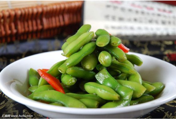
糟毛豆 – tao mao đậu

桂花米藕ngó sen nhồi bột hoa quế : món ăn truyền thống trong một khu vực phía Nam độc đảo Món trắng miệng của Trung Quốc được biết đến với hương thơm ngọt ngào, thơm ngon, thơm và ngọt ngào.