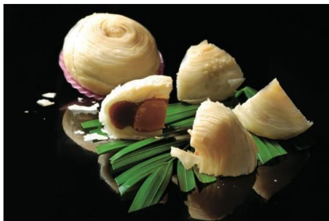
Long Nhân tô