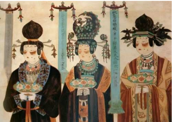
Hồi cốt kễ

Trong mắt người tình hóa tây thi, Kỷ Hải nhất thời cảm thấy thiếu nữ này quả thực giống như là tiên nữ trong Thiên cung hạ phàm, nhìn nàng si ngốc không nói nên lời.