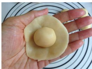
油酥面团 Du tô diện đoàn