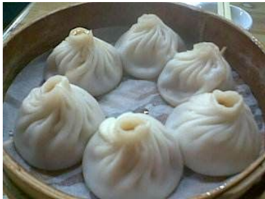
汤包 Tang bao

Tiêu Kỳ nói: “Kính mời Trình nương nương nếm thử tay nghề đầu bếp này xem sao.”