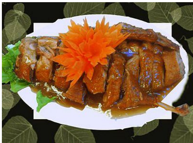
Vịt Bát Bảo

*Chương này có nội dung ảnh, nếu bạn không thấy nội dung chương, vui lòng bật chế độ hiện hình ảnh của trình duyệt để đọc.