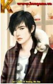
ANH NĂM CỐ TRƯỜNG PHONG