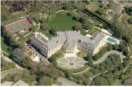
Ghi chú: đây là ngôi nhà hiện tại của cô