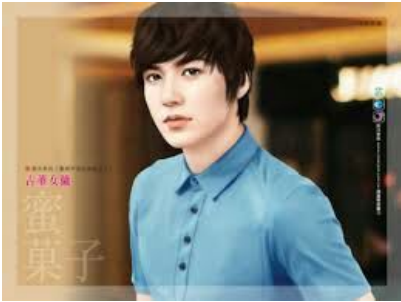
NAM CUNG LÃNH HÀN NHỊ THIẾU