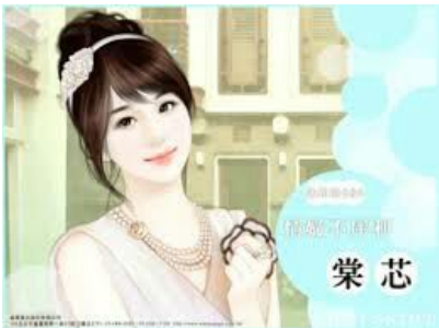
EM TRAI CÔ THỨ 8 CỐ TRƯỜNG HUY.