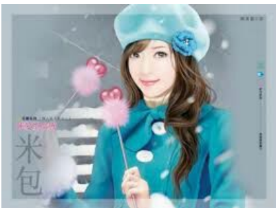
NAM CUNG HUYỀN HUYỀN NGŨ TIỂU THƯ.