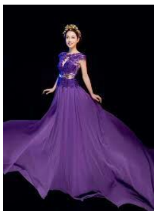
CỔ TRƯỜNG NINH