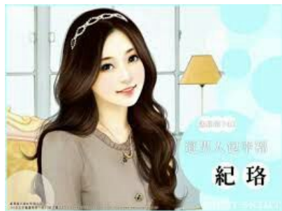
ÂU DƯƠNG ÁNH NGUYỆT TAM TIỂU THƯ ÂU DƯƠNG GIA. HAI NGƯỜI NÀY LÀ CHỊ EM SINH ĐÔI.