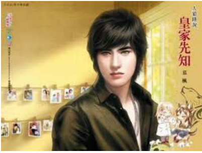
ANH TƯ CỐ TRƯỜNG LIỆT