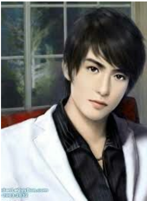
NAM CUNG LÃM BĂNG TAM THIẾU