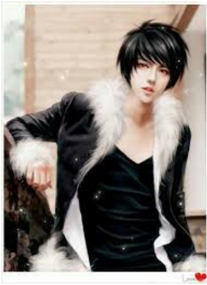
ANH SÁU ANH SINH ĐÔI CỦA CÔ CỐ TRƯỜNG PHI