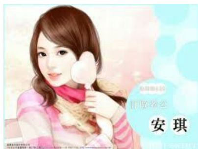
LAM TƯ THÂN PHẬN HẾT SỨC BÍ ẨN