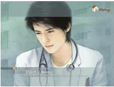
NAM CUNG LÃNH THIÊN ĐẠI THIẾU GIA