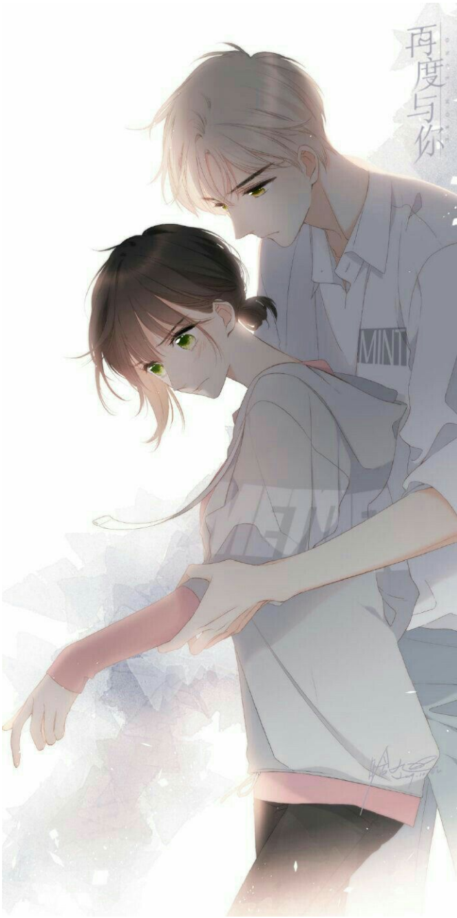
Đây là bộ Cùng em thêm lần nữa, cùng tác giả vs Tình yêu màu hoa anh thảo.