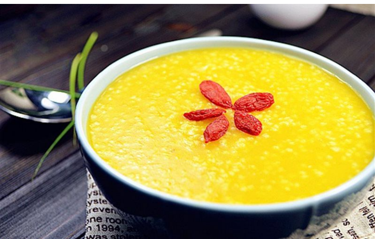
Cháo thịt băm trứng vịt bắc thảo

Này chương bởi vì sửa lại vài biến, cho nên chậm một chút thời gian, về sau đại gia nếu là thấy ta không có đúng giờ đổi mới, liền nhìn xem văn án thượng thông cáo khu, ta sẽ ở mặt trên lại một lần nữa nói cho đại gia cụ thể đổi mới thời gian.