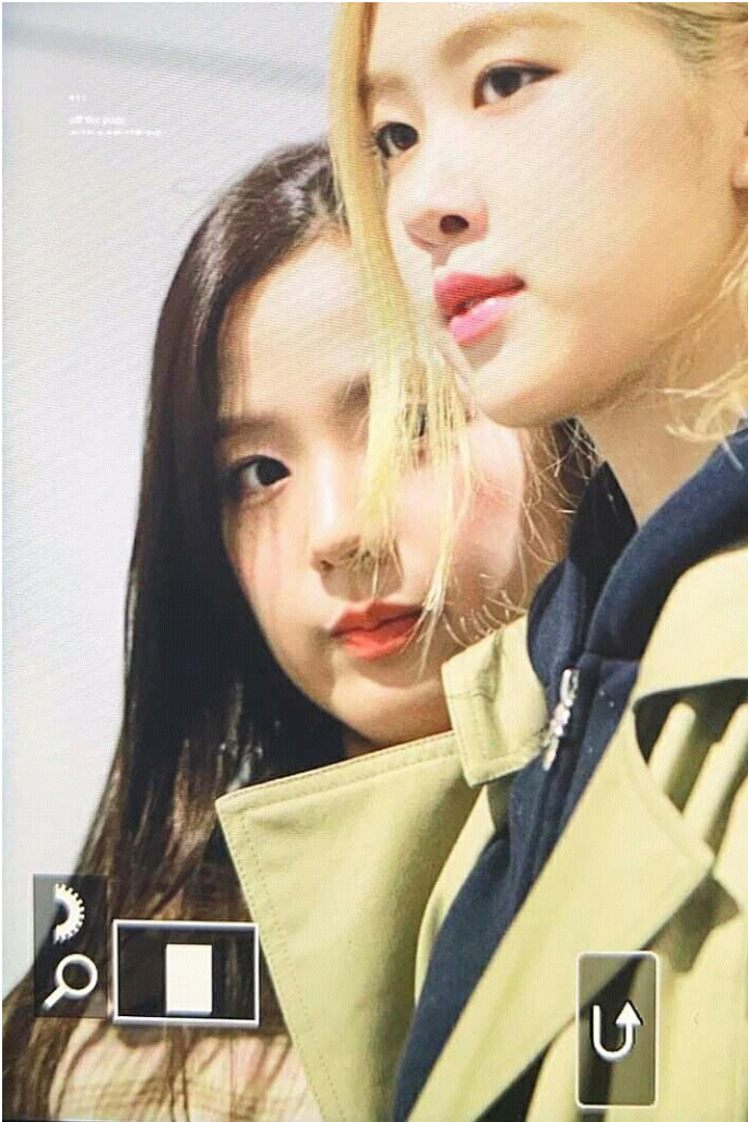
Còn đây là một vài tấm mới nhất