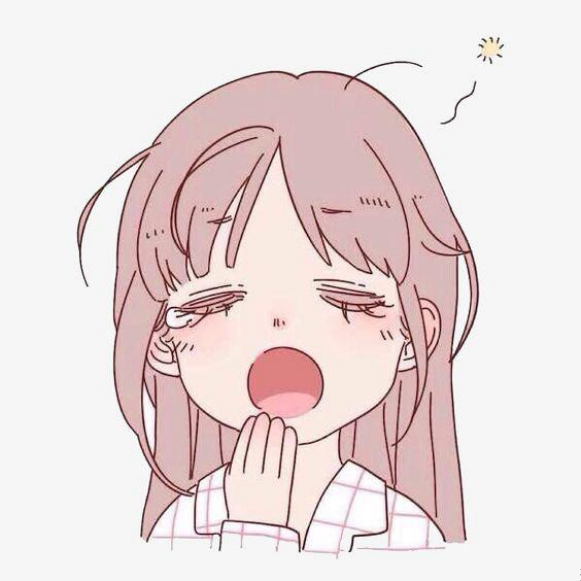
Đăng chương này thật sự không biết ghi caption gì luôn :)

*Chương này có nội dung ảnh, nếu bạn không thấy nội dung chương, vui lòng bật chế độ hiện hình ảnh của trình duyệt để đọc.