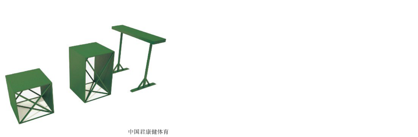
Cầu nhảy cao

Ba nữ sinh xuất phát cùng một lúc, vượt qua cọc, chiến hào, tường thấp, cầu nhảy cao, thanh ngang, cầu độc mộc (loại cầu được làm từ một thanh gỗ duy nhất bắc ngang qua), tường cao, lưới cọc thấp, tổng cộng có tám hạng mục. Từ Á có thể lực khỏe nhất trong ba người, một khi xuất phát là bỏ hai người còn lại ở phía sau, từ đầu đến cuối Nam Sơ và Nghiêm Đại vẫn theo nhau sít sít, trước mặt là con đường sinh lầy lội phải đi ngang qua, đằng sau là nhóm chiến sĩ ra sức kêu gào.