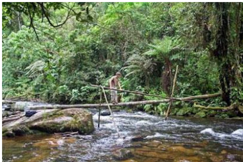
Cầu Độc Mộc