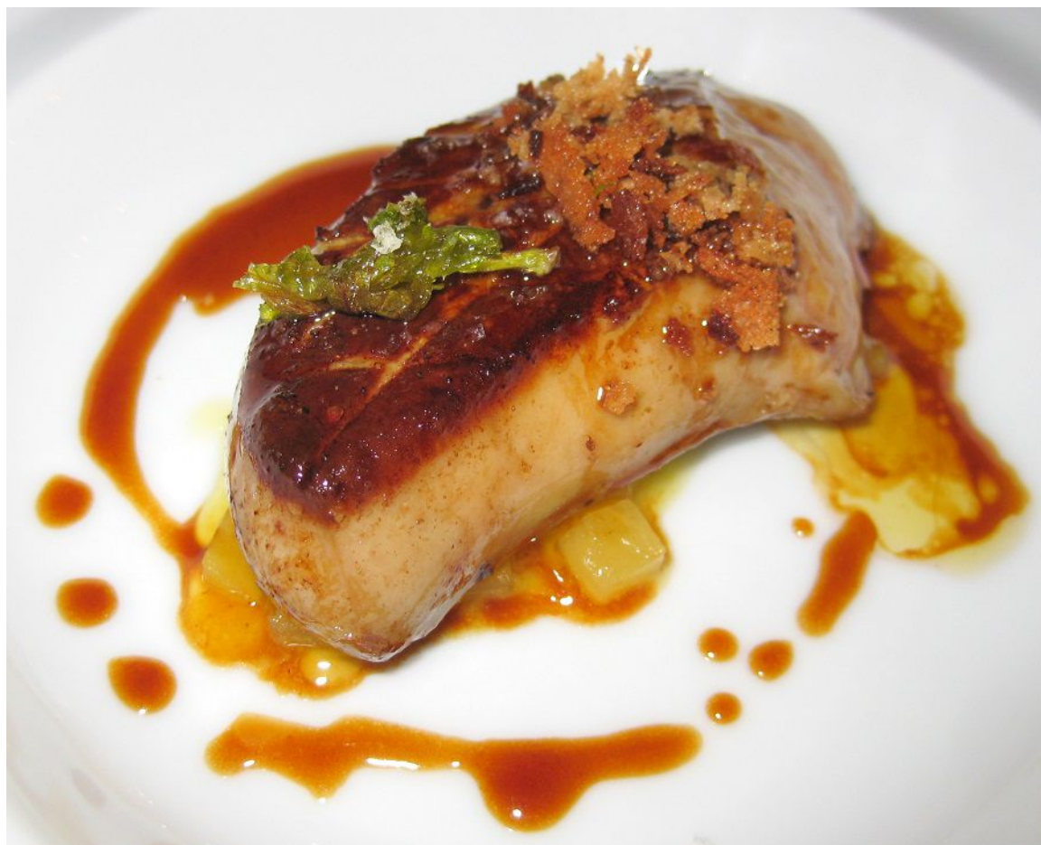
Sườn cừu nướng