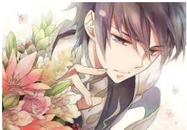
-Chào các ngài, tôi là Chu Minh Viễn, anh trai của Kiều Nhi.

Đi cuối cùng là Vũ Đình Thiện(nam 9 mới): tổng giám đốc của tập đoàn Vũ thị lớn mạnh nhất nhì trong nước về phương diện kinh tế. Vũ Đình Thiện là cô nhì từ khi sinh ra. Anh ta đã một mình gây dựng được tập đoàn hùng mạnh như bây giờ lại còn đẹp trai nên cũng là mục tiêu của các cô gái. Anh có đôi mắt màu tím cùng màu với mái tóc. Bộ lễ phục anh mặc có màu đen rất chín chu.