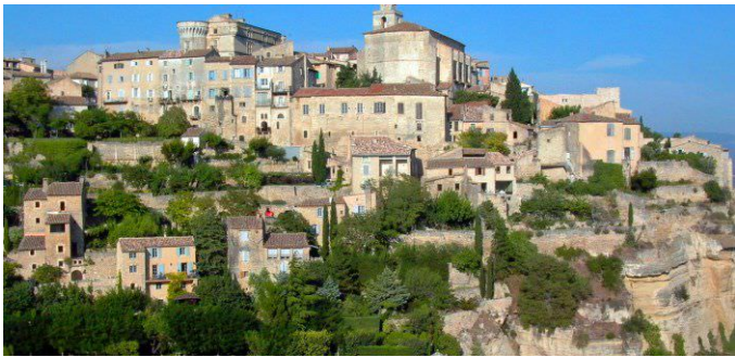
Sam Y không quên đặt chân đến ngôi làng les Baux de Provence nằm trên một hòn đá ở độ cao 245 mét, là trung tâm lịch sử của bảo tàng của santors, Hôtel des Porcellets, ngôi nhà đẹp của thế kỷ 16, nhà thờ St Vincent với lối kiến trúc Roman độc đáo...