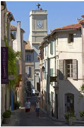
Hùng Vũ dẫn Sam Y vào khu chợ Saint Rémy, hai người đi đúng vào thứ Tư là lúc chợ họp đông nhất, nơi đây tràn đầy sắc màu tươi tắn và những hương thơm thanh khiết từ hoa quả và các sản vật của vùng. Sam Y thích thú chọn mua những sản phẩm chăm sóc sắc đẹp được chế biến hoàn toàn từ thiên nhiên, đặc biệt là những chai tinh dầu hay sữa tắm được làm trực tiếp từ lavender. "Băng Băng nhất định rất thích", Sam Y nghĩ ngay đến cô bạn thân nhất của mình.