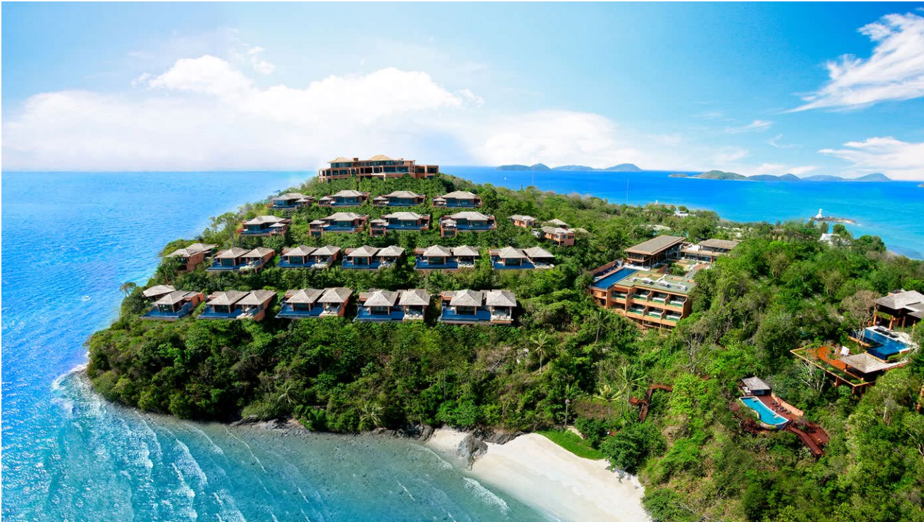
*Phòng Luxury Pool Villa