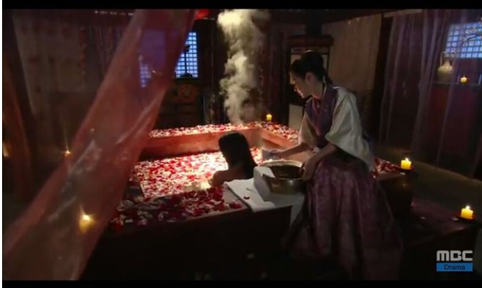
Mái tóc đen nhánh được chải mượt mà, buông xoã trông càng trở nên xinh đẹp.