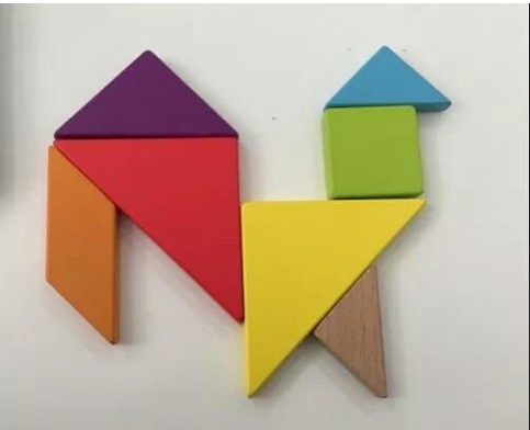
(Trò xếp gỗ)