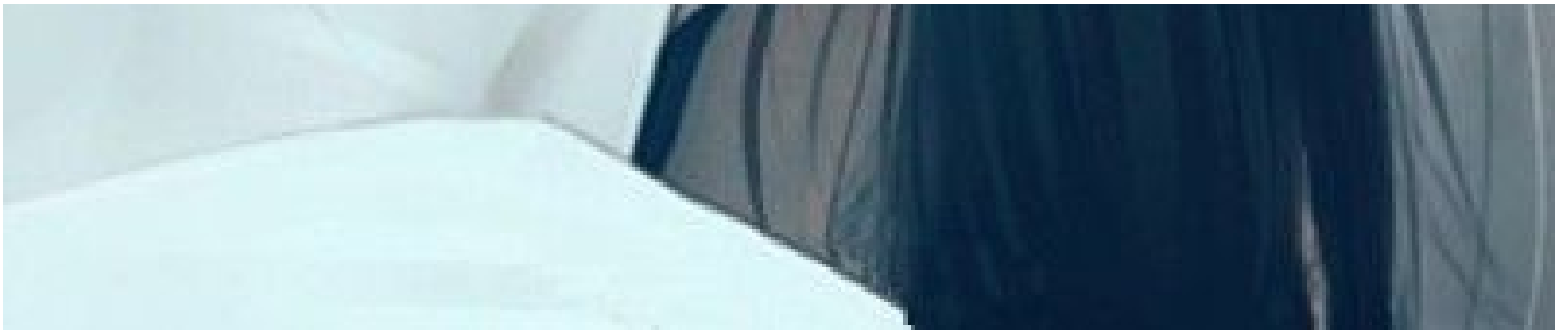
Một tấm ảnh sưu tầm