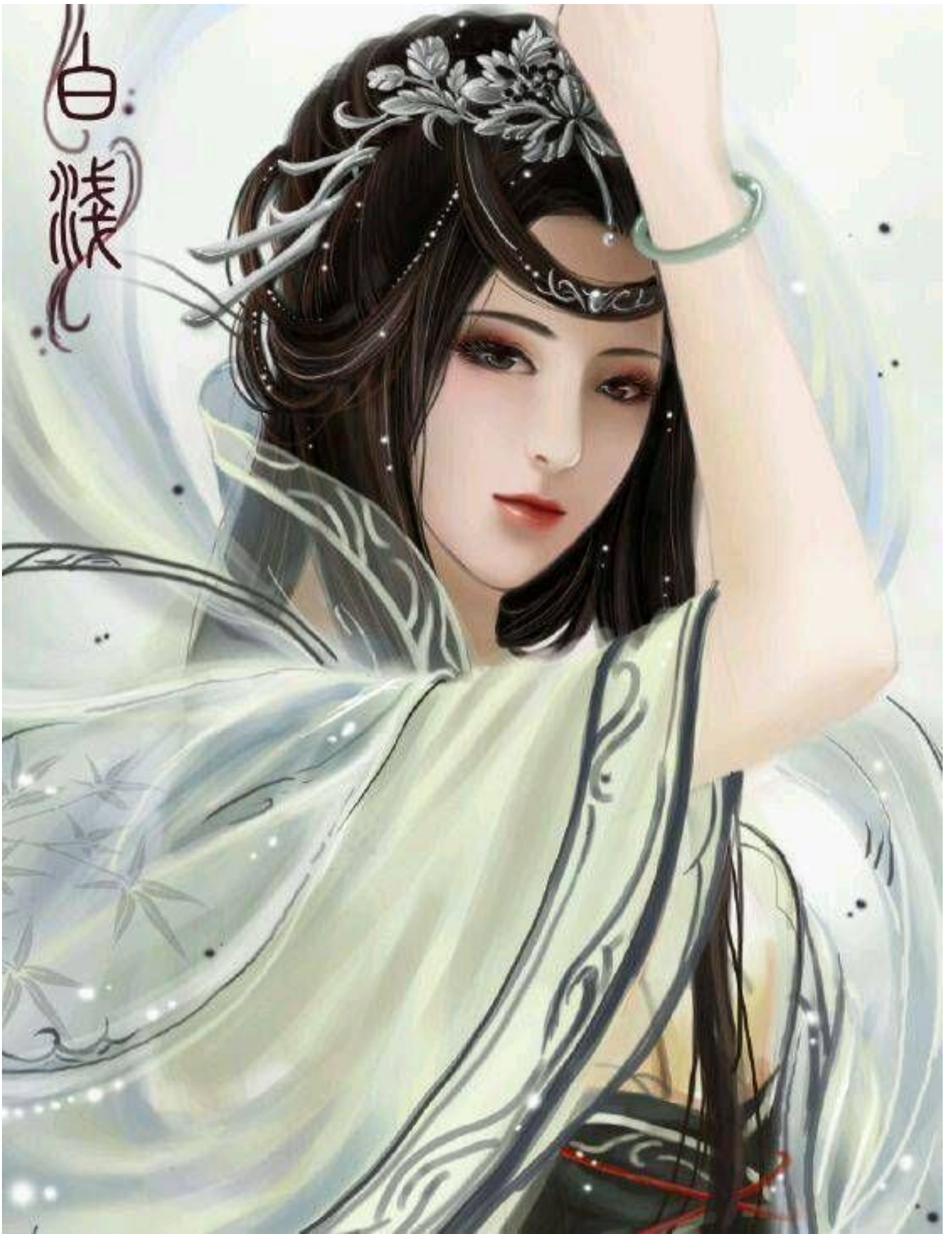
Một tấm ảnh sưu tầm