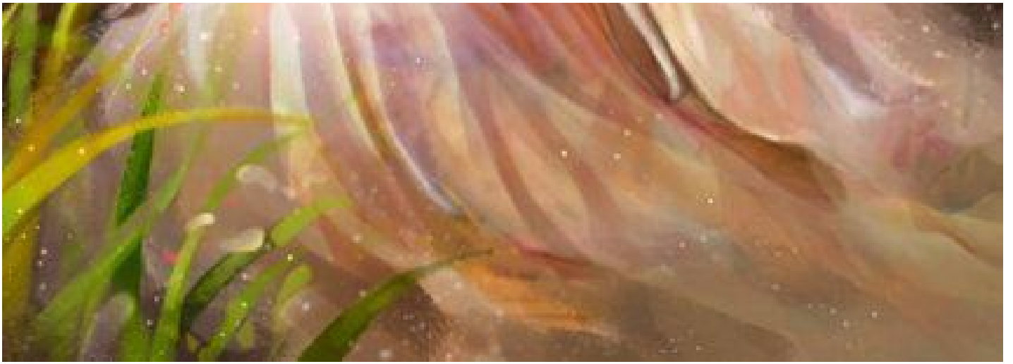
Một tấm ảnh sưu tầm