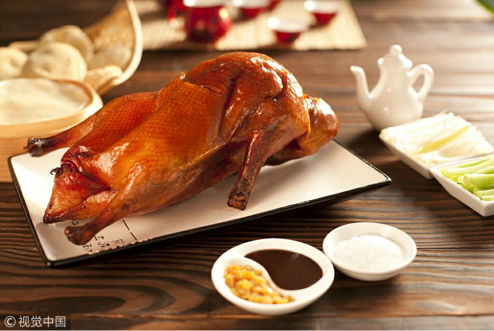
Ảnh chân thực luôn cho mọi người thêm~~ Đây là vịt quay Bắc Kinh, mẹ mình lên Lạng Sơn chơi rồi mua về cho mình. Lúc về Hà Nội vịt vẫn còn ầm ầm, được gói trong n lớp giấy báo. Thịt mềm, da giòn, ăn béo béo, mình mê nhất là cái nước sốt của nó. Ăn thịt vịt trộn với cơm là đủ, chả cần phải ăn thêm gì khác nữa. 260k một con, mình để ăn 2 ngày mới hết, hihi.