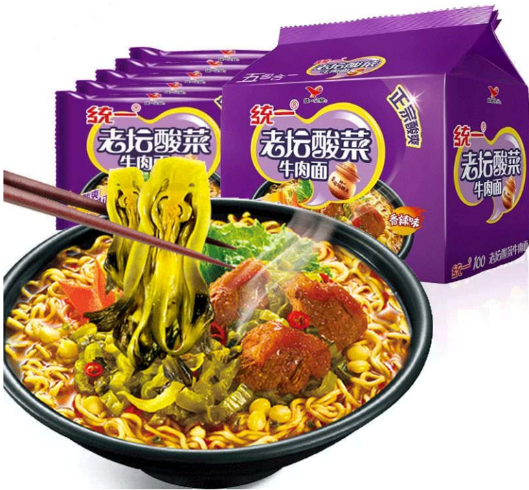
[3] Cá phi lê sốt cay