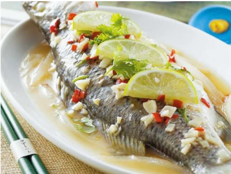
Video hướng dẫn cách làm cá chanh

[2] Ban công kín: bạn nào xem Yêu em từ cái nhìn đầu tiên thì ban công nhà Tào Quang nơi đặt chú mèo là dạng ban công kín này.