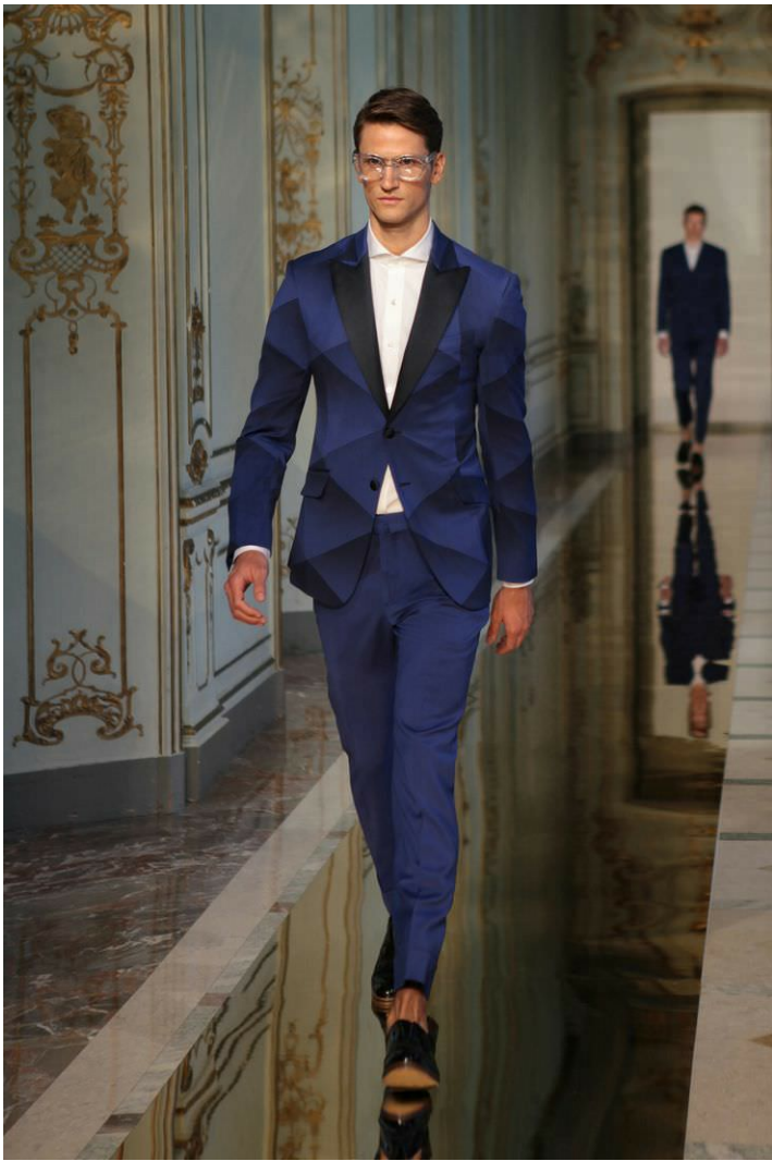
[2] Jimmy Choo: Trong thực tế là Jimmy Choo, là một nhà thiết kế thời trang Malaysia có trụ sở công ty tại London, Vương Quốc Anh. Công ty Jimmy Choo Ltd do ông sáng lập nổi tiếng trên thế giới với các sản phẩm giày, túi xách làm thủ công.