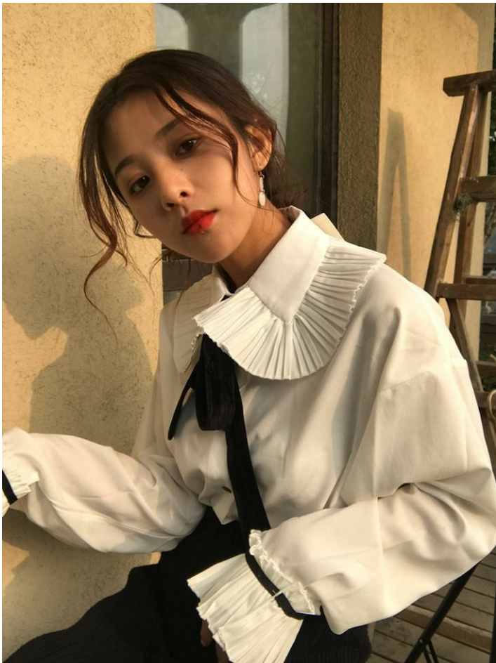
[4] Áo phao bánh mì