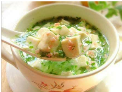
Video hướng dẫn cách làm canh đậu phụ phi thủy

Bạn đang đọc truyện Búp Bê Cầu Nắng được tải miễn phí tại www.EbookFull.Net .