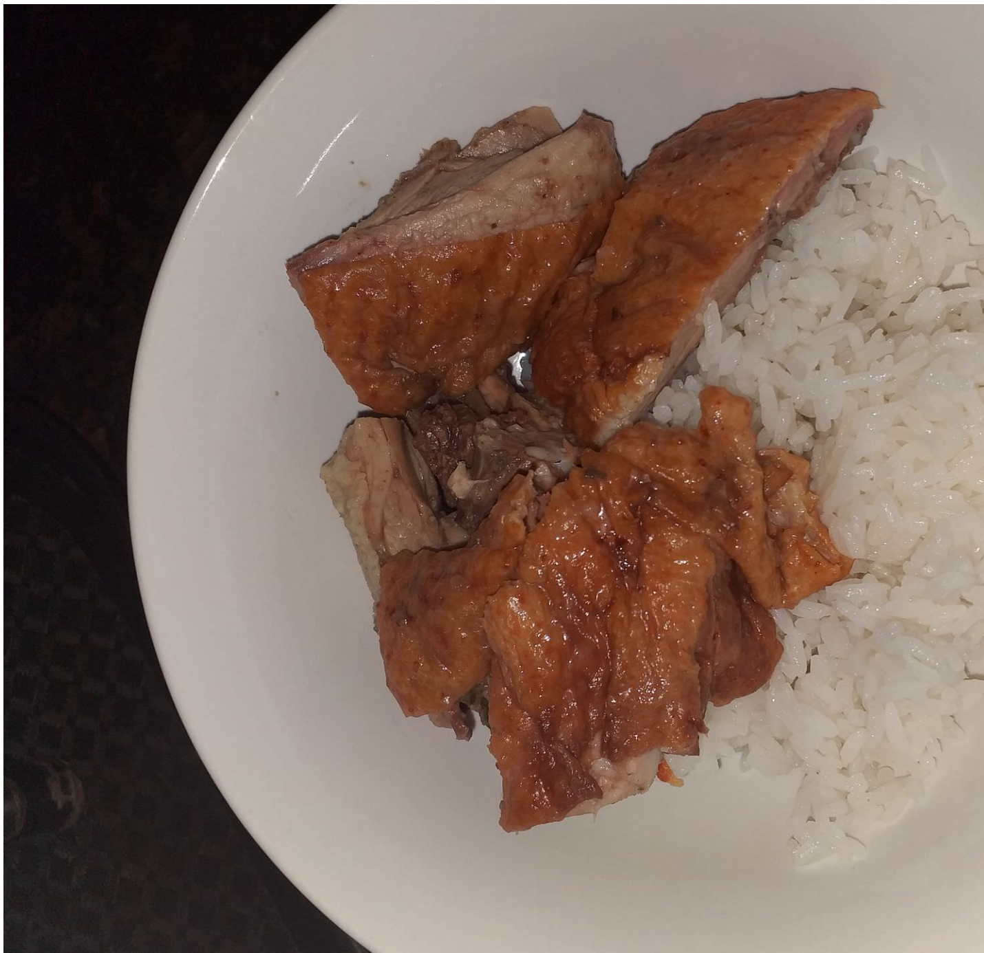
Video hướng dẫn cách làm vịt quay bắc kinh