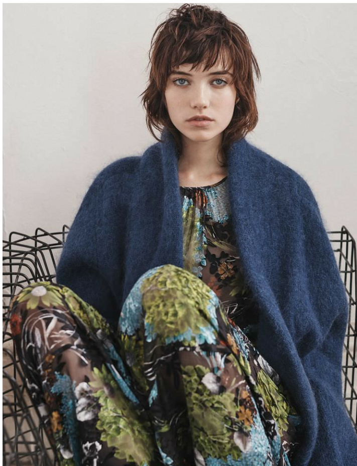
[2] Bàn lam căn