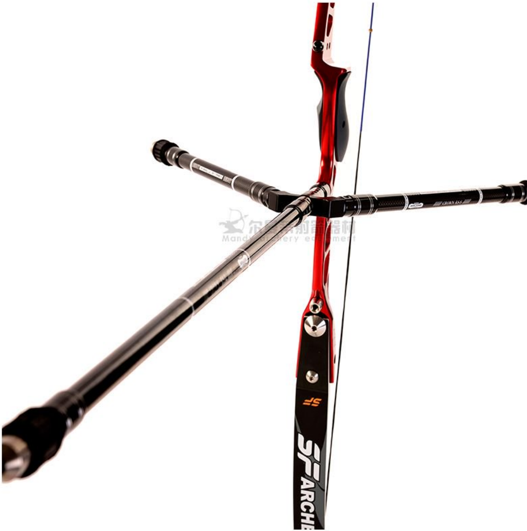
Miếng dọi thanh (响片): hoặc phiên báo hiệu, phiên phản xạ âm thanh...