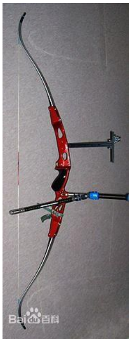
Thanh cân bằng (平衡杆)

Recurve - 反曲 (tên tiếng anh, trong tiếng Việt không có từ này): là cây cung với phần rìa uốn cong cách xa cung thủ khi không căng dây. Cung tích trữ nhiều năng lượng hơn và cung cấp năng lượng hiệu quả hơn so với cung thẳng tương đương, cung cấp một lượng lớn năng lượng và tốc độ cho mũi tên.