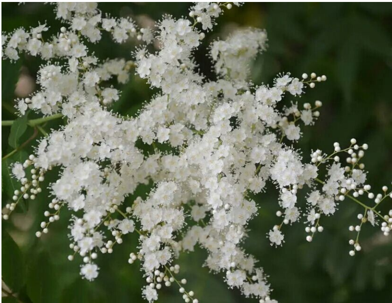
Đây là hoa Mễ Mảnh