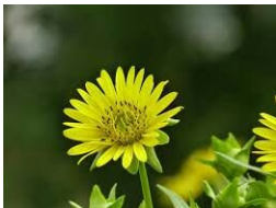
Còn đây là Xuyên Diệp vàng miêu tả trong đoạn đầu.

Nguồn: Baidu nhé, tìm cho mọi người thả sức hình dung ^^