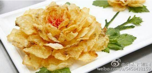
(khắc hoa mẫu đơn)

Tề tướng đương triều lại không bằng một thiên sư nửa đường sát ra, thật khiến người khác thất vọng.