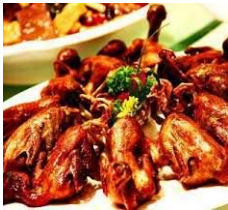
(Đũa đầu xuân)