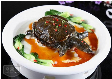
(cầm trang ba ba)