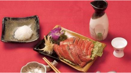
(ngỗng quay Yên Chi)

Bạn đang đọc truyện Nhân Duyên Tiên Định được tải miễn phí tại www.EbookFull.Net .