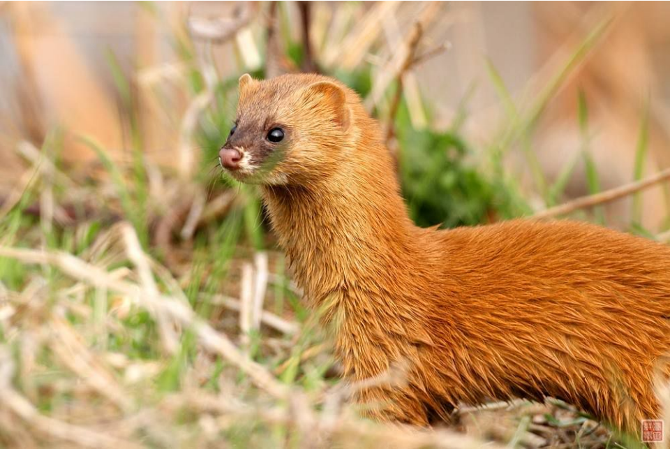
(*) Mustela sibirica là một loài động vật có vú trong họ Chồn, bộ Ăn thịt.

Bạn đang đọc truyện Nhân Duyên Tiền Định được tài miễn phí tại www.EbookFull.Net .