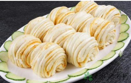
Bánh bao hoa cuộn

Góc áo kia run rẩy một chút, sau đó một nam hài mười tuổi nép sau lưng cây đào đi ra.