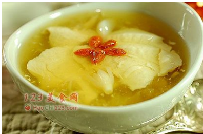
(canh mã đề nấu với tuyết nhĩ và đậu phụ)