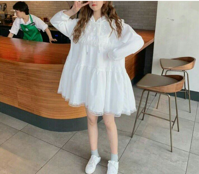
Về phía Alie thì cô nàng mặc một chiếc váy trắng trẻ vai