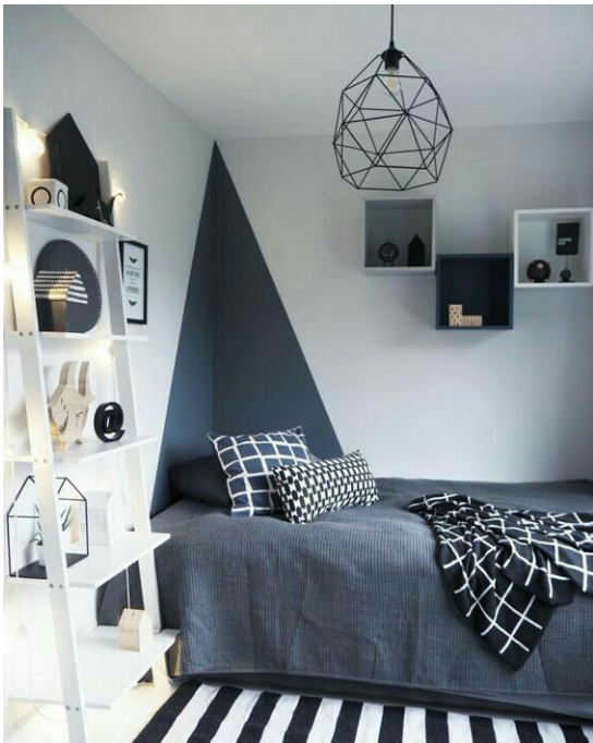
Ở phía góc bên kia còn được đặt một cái bàn học dành riêng cho nó để học bài, bên cạnh còn có một cái kệ để các loại đồ dùng mà nó thích nhất