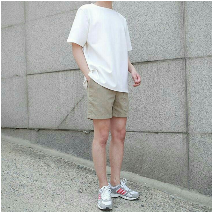
Hắn thì ăn mặc với đúng tính cách của mình, tuy bề ngoài toát ra sự băng lãnh và đáng sợ nhưng vẫn là trung tâm cho khối cô nàng nhìn ngắm