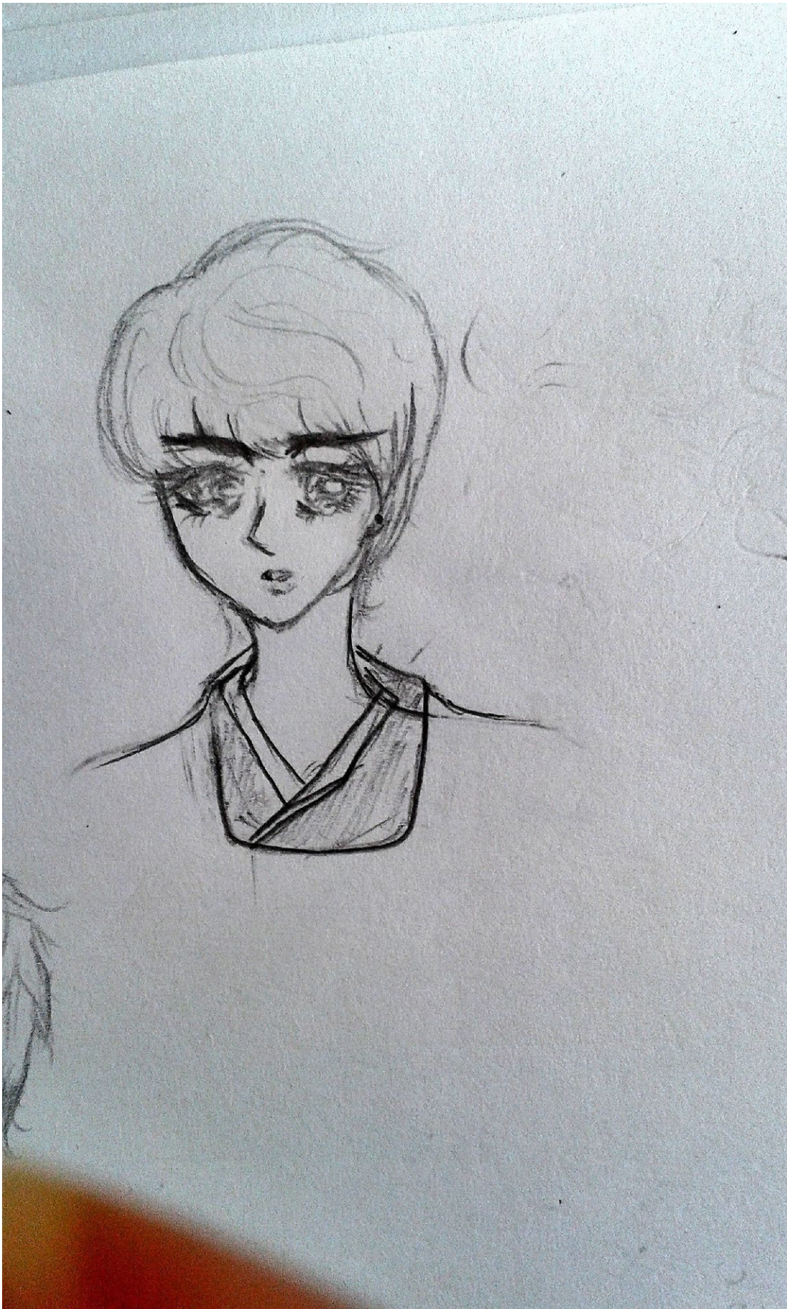
Gil nĩa chứ, cảm nĩn luôn.:))))))