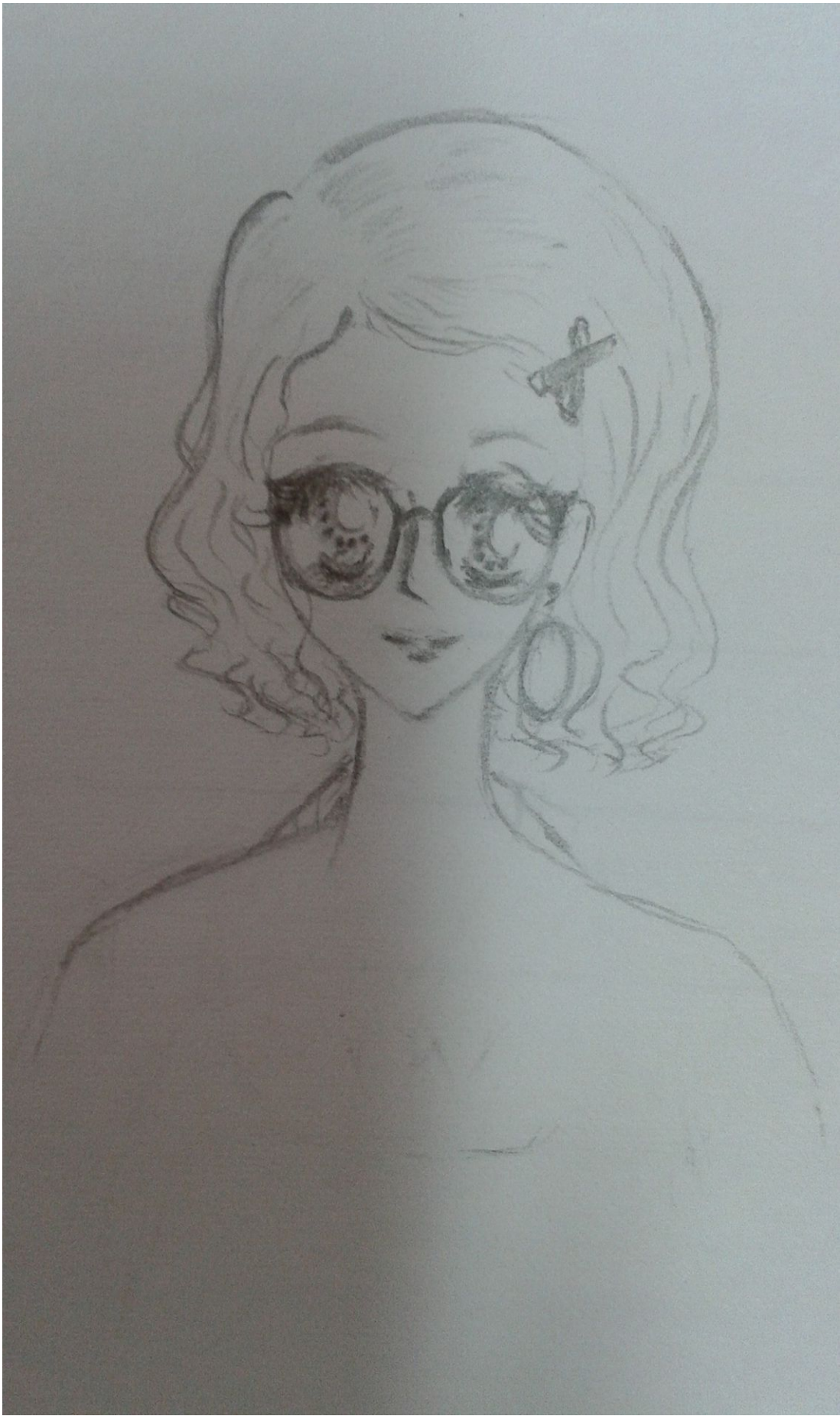
Và sau biến cố ấy.