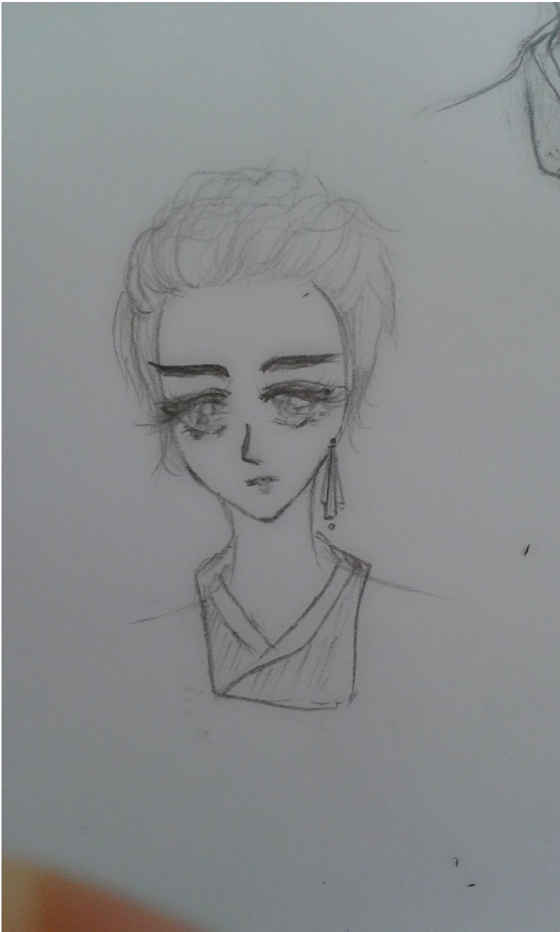
Bất ngờ hơn, ngày xưa mình vẽ Gabriel trông như này, chết cười.