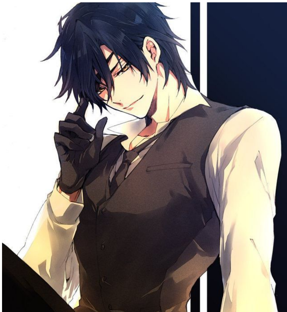
Minh ca khi giả ngọc: (lúc quyến rũ Huyền tỷ đó)