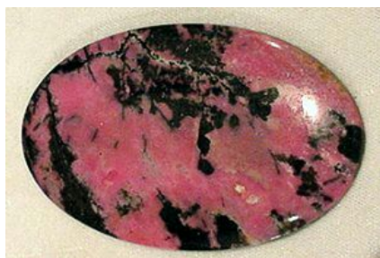
HI.2 Đá đào hoa được khai thác ở Châu Âu.

Bạn đang đọc truyện Kiều Sủng - Khai Hoa Bất Kết Quả được tải miễn phí tại www.EbookFull.Net .