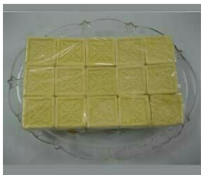
[4] Bánh xốp sữa dê