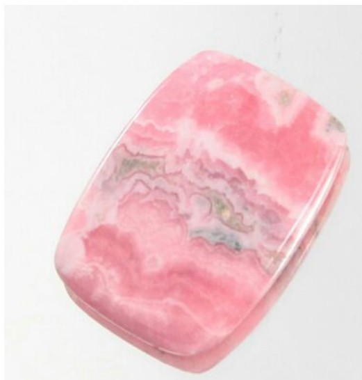
HI.1 Đá đào hoa được khai thác ở Châu Á.