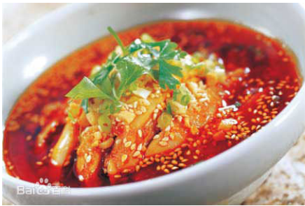
(3) Rau trộn hải sâm sống: