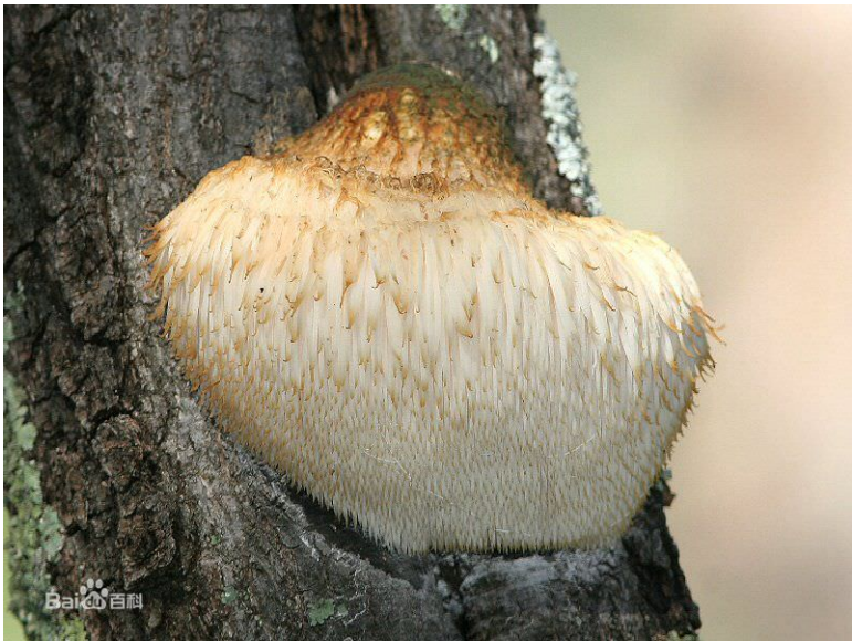
(5) Hồng báii hầii đầii cồii: