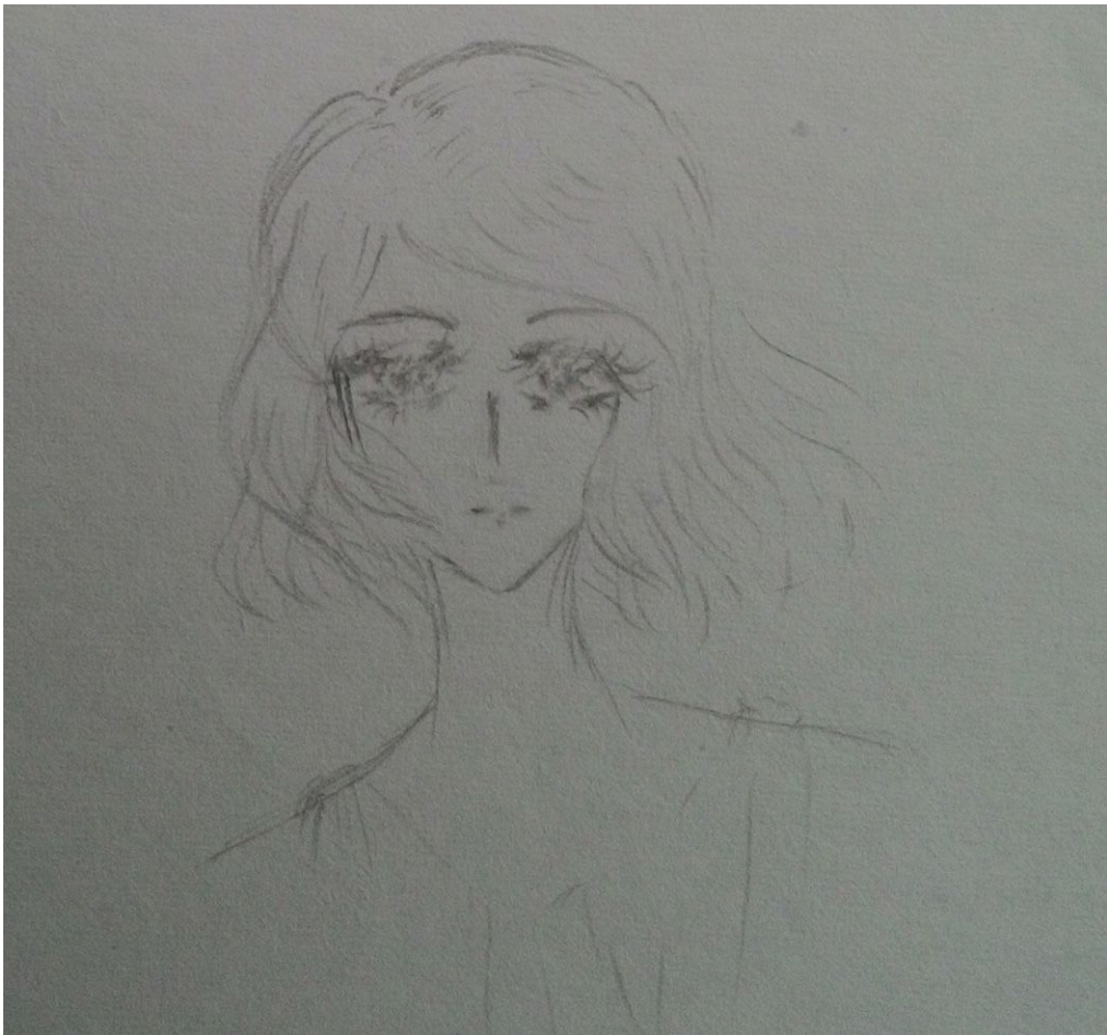
Nhưng mà tiếc là thánh Fly k lớn nữa, nên đây chỉ là tương tượng thôi.