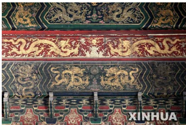
[4] Ngai vàng địa bình: