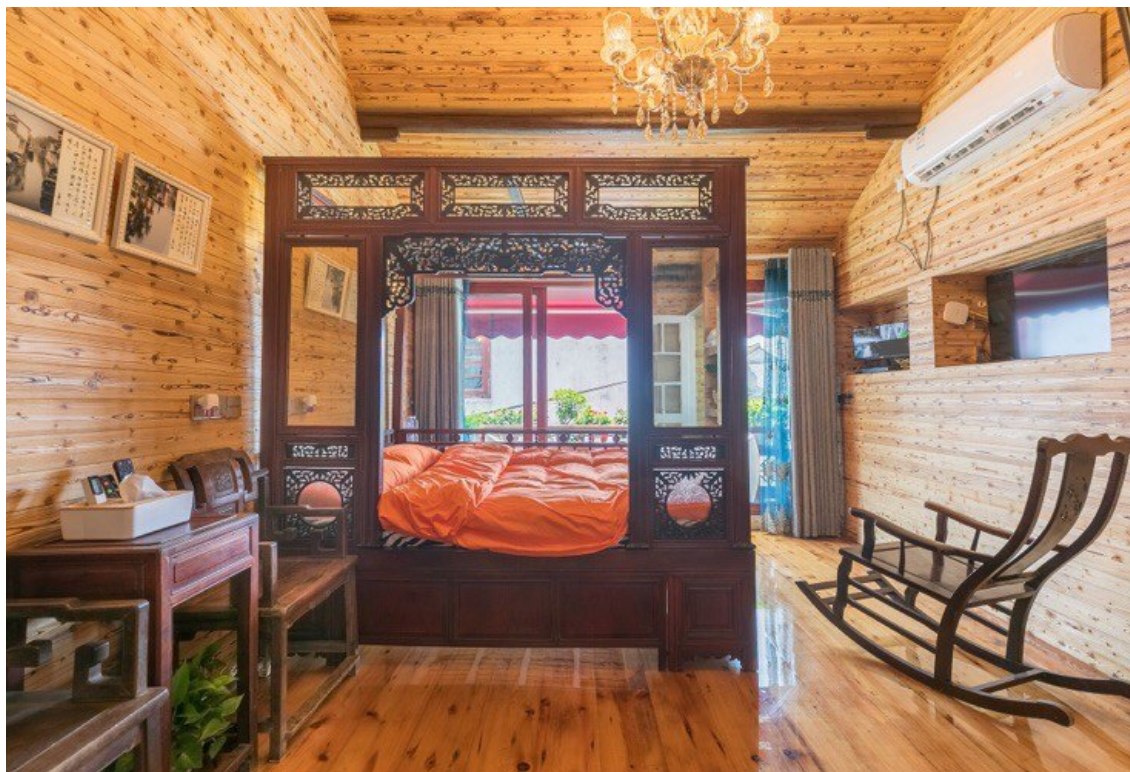
giường Hoa Điều

Hiên Viên Diễm đuổi theo, lúc ra tới nơi nhìn thấy Mộc Đào Đào giống như mất hồn ngồi ở cửa đại môn, mắt cũng mất đi vẻ sáng rỡ, trên khuôn mặt nhỏ nhắn hiện đầy nước mắt, phải tìm của hân cũng đau. Ngay cả lúc Hiên Viên Diễm khom lưng ôm nàng dậy cũng không có một chút phản ứng.