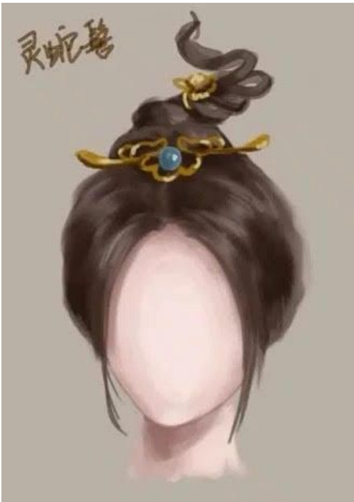
[5]Nguyên Bảo kế