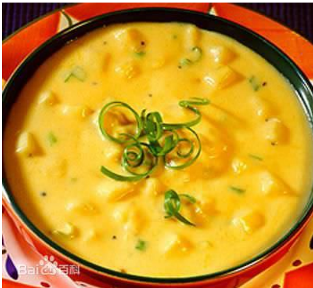
Miến tiết vịt: