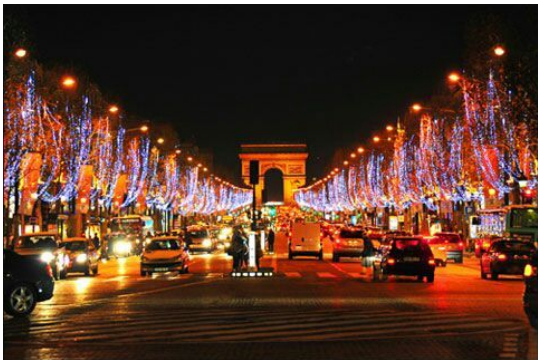
3. Bánh Canelés