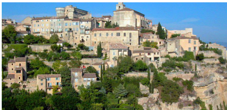
Sam Y không quên đặt chân đến ngôi làng les Baux de Provence nằm trên một hòn đá ở độ cao 245 mét, là trung tâm lịch sử của bảo tàng của santons, Hôtel des Porcellets, ngôi nhà đẹp của thế kỷ 16, nhà thờ St Vincent với lối kiến trúc Roman độc đáo...