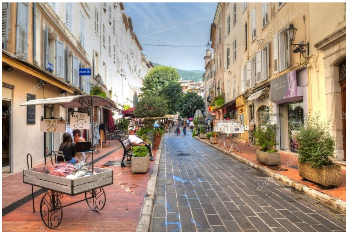
Sam Y đặc biệt thích thú khi đến với Gordes, làng ngòi ở Luberon, một trong những ngôi làng đẹp nhất ở Pháp được hoàn toàn xây dựng bằng đá khô.