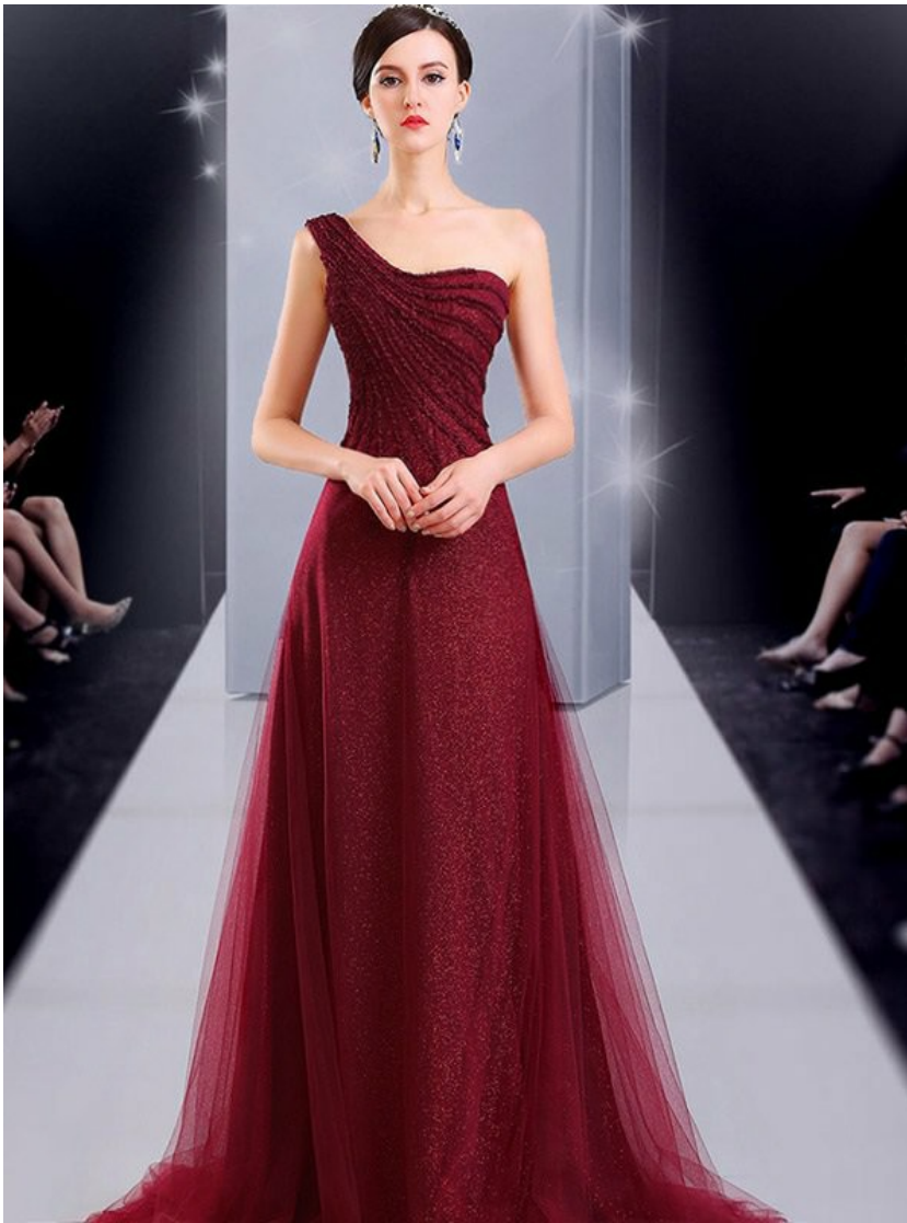
( Ảnh chỉ mang tính chất minh họa )

“Đường Ngọc Kỳ, thật là cậu.” Vừa tiến vào hội trường, Liễu Tinh bọn họ gặp phải Tiêu Giác cùng bạn đồng hành.